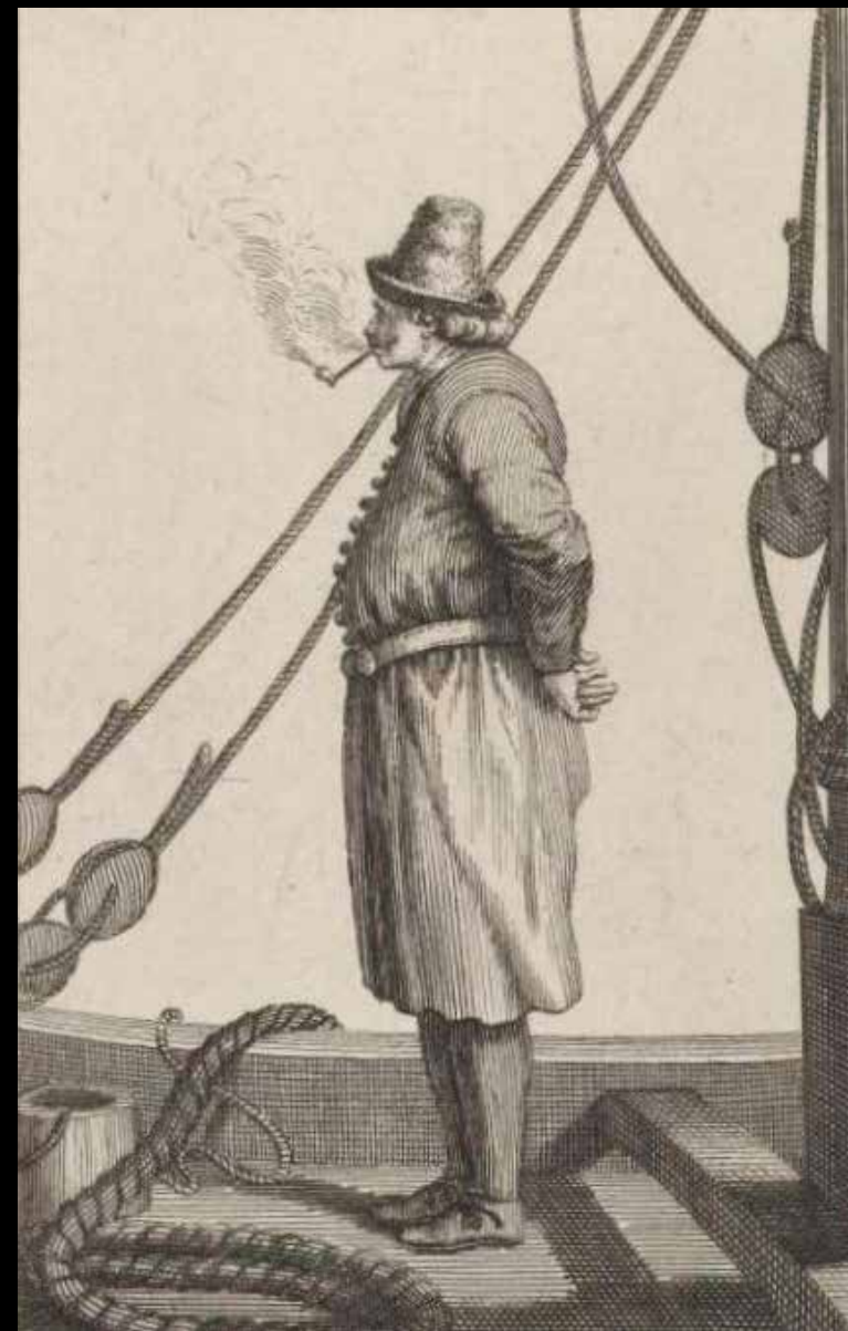
Piprökande man vid vattenhink ombord på ett holländskt fartyg. Kanske såg det ut så även ombord på svenska fartyg där de rökande hänvisades till en balja vid stormasten. Brabantse matroosen Brabantse boerin Diverses modes Dessinées d'apres Nature av den franske konstnären Bernard Picart. 1728.

Försöken att reglera vart de gemena tilläts röka pekar dels på att "idealen" i sjöartiklar och förordningar inte följdes, men också på att tidigare försök till åtgärder möjligen inte haft önskad effekt eller varit helt realistiska. Dessa uppmaningar har varit ämnade att minimera eldrisken ombord då brandrisken generellt var stor. Fartygen var av trä, och ombord fanns många brandfarliga material som tjära och krut. 87