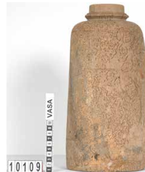
Snidad träflaska från Vasa . Vasamuseet. Statens maritima och transporthistoriska museer. Fotograf: okänd. CC-BY SA.

På Vasa har bland annat sju intakta trästånkor påträffats. Uppskattningar baserat på fragment pekar på att det troligen rör sig om totalt minst 19 stycken stånkor, med volymer mellan 2,24–2,6 liter. De har alla någon form av handtag och majoriteten har troligen varit försedda med lock. Liknande dryckeskärl av tenn och keramik har också hittats ombord i skeppets akre delar där de högre befälen huserade. Tennstoppen hade liksom trästånkorna lock, dock av tenn. Samtliga av dessa dryckeskärl kan kopplas till konsumtion av öl. Utöver detta har även 3 supkoppar av keramik hittats på skeppet. Dessa har använts för konsumtion av både mat och dryck. Bland fynden finns även ett passglas som uppskattas ha rymt runt 400 ml. Kärlen kan huvudsakligen kopplas till förtäring av drycker, och då sannolikt alkoholhaltiga sådana. 109