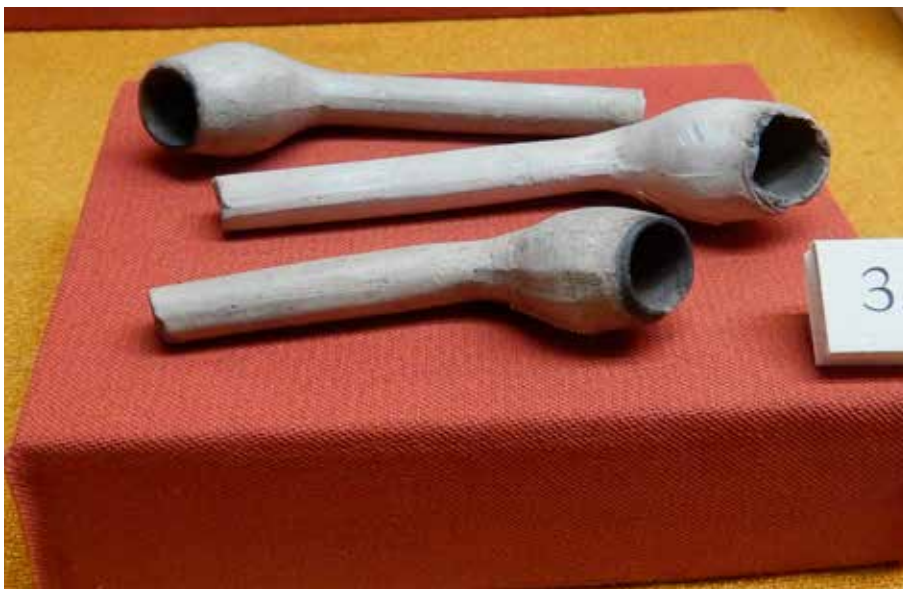
Kritpipor från skeppet Solen som förliste utanför Gdansk 1627. Bild tagen av författaren i utställningen om skeppet Solen på Narodowe Muzeum Morskie i Gdansk.