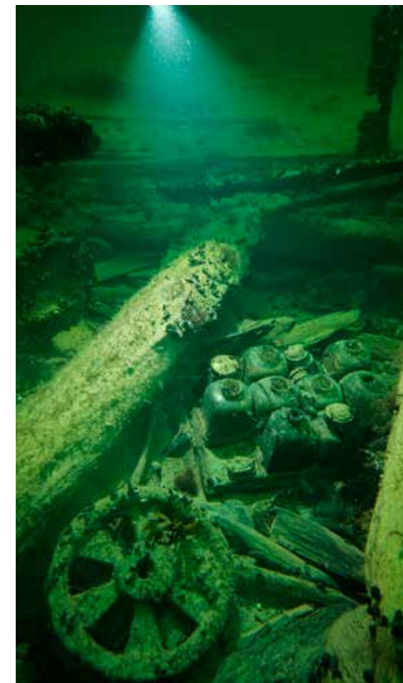
Schatull i trä med kvadratiska glasflaskor på Resande Mans vrakplats. Statens maritima och transporthistoriska museer.

Men det finns ett fåtal till synes ännu intakta och tillslutna flaskor på vrakplatsen där det möjligen kan finnas spår av, eller till och med bevarad, vätska. Inga flaskor har hittills bärgats och analyserats, och deras innehåll är därför ännu okänt. Men det är, på grund av käriltyper, troligt att det rör sig om vin eller brännvin.