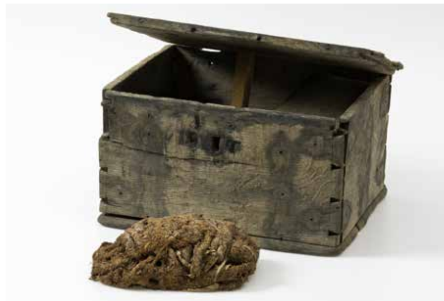
Tobak och en liten träkista från Kronan . Kalmar läns museum.

På skeppet Solen som sjönk utanför Gdansk 1627 har minst tre kritpipor hittats. 110 Dessa påminner i utseendet mycket om den kritpipa som hittats i en tunna ombord på Vasa . Vart kritpipan tillverkats har dessvärre inte varit möjligt att utröna då dess typ förekommer både i England och Holland, och den saknar stämpel och klackmärke. 111 På och runt Vasa , har sammanlagt närmare 140 kritpipor hittats, där sex möjligen skulle kunna