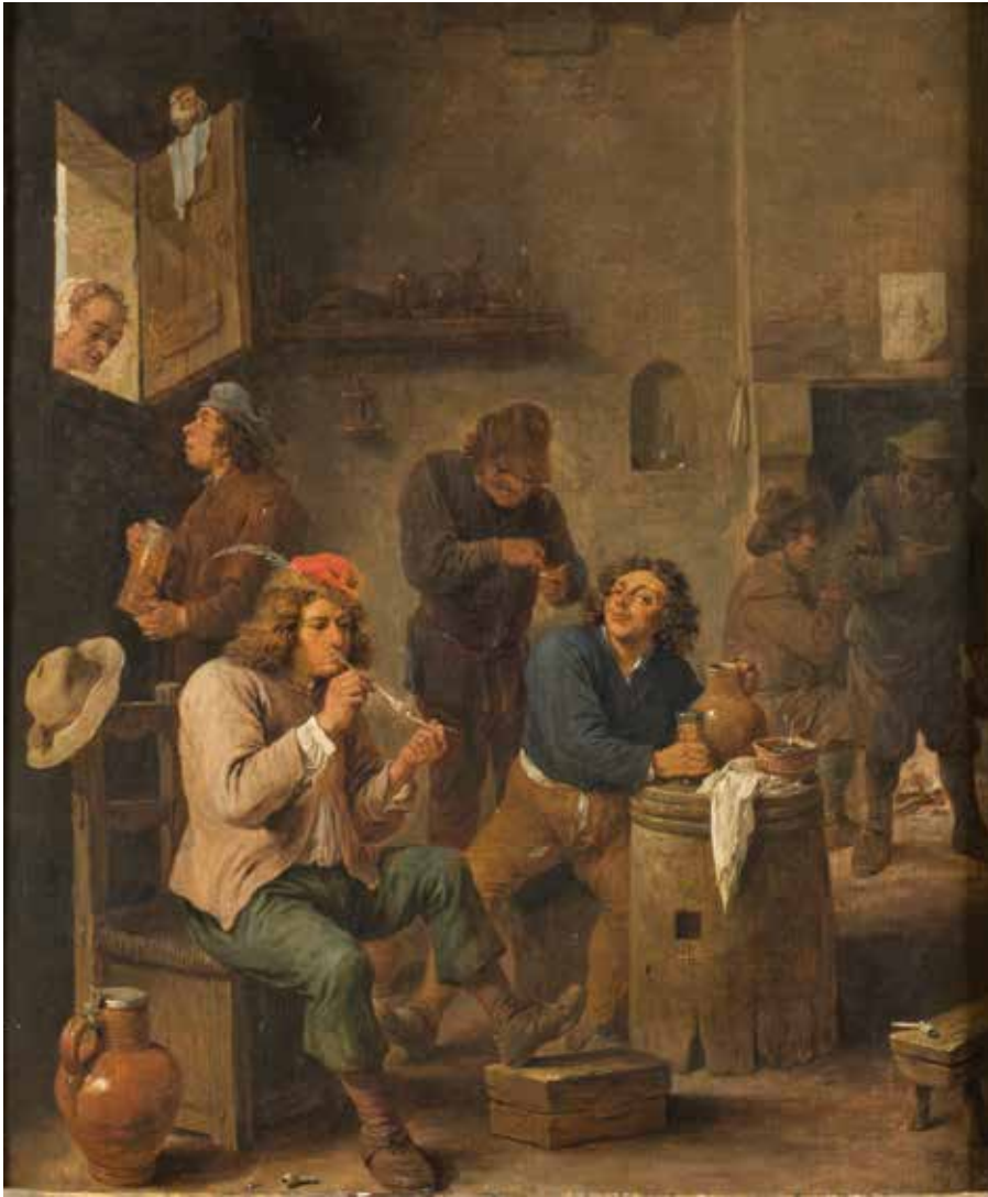
Abildning av ölstuga från 1661 av den holländske konstnären David Tenniers den yngre. Notera keramikkrusen, stopen och kritpiporna, vilka även förekom i Sverige vid tiden.