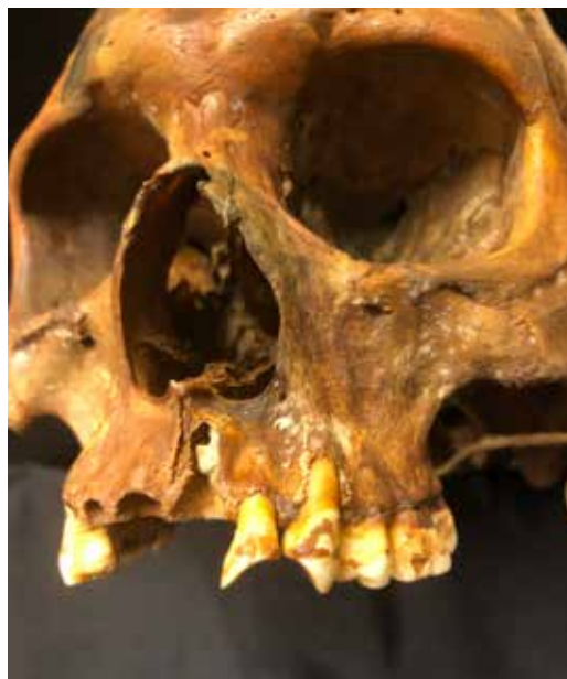
Abrasionsspår på kranium 66 från Kronan. Notera den skålformade nednötningen på tänderna, vilken troligen uppstått i samband med rökning med kritpipa. Stockholms Universitet.

Ombord på Vasa har bevarade växtfibrer hittats i en liten svepask i samma tunna som den påträffade kritpipan. Möjligen rör det sig om tobak, vilket framtida analyser kanske kan påvisa. 117