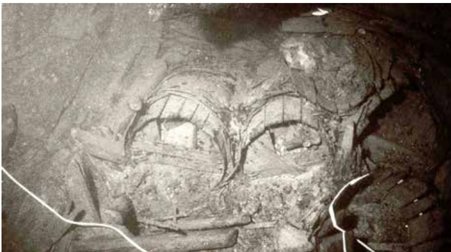
Tunnor på Kronans vrakplats.

som förliste 1678. Bartmannkrusen på vraket har daterats till 1600-talet, men inga analyser har gjorts för att om möjligt utröna deras innehåll. Sådana kärl var dock främst avsedda för förvaring av vin eller öl, men kan mycket väl ha återanvänts till andra drycker eller produkter som olja. Dessutom användes den mindre varianten av kärlen, åtminstone under senare delen av 1600-talet, ibland som dryckeskärl av de högre befälen. 104