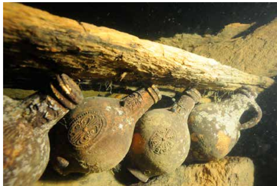
Bartmannkrus på vraket efter Bodekull. Notera den uppstickande reliefen på kärlets halsar föreställande skäggiga män, samt krusens olika sigill på kroppen. Statens maritima och transporthistoriska museer.

Björn Lindekes tolkning av den analyserade alkoholen från Kronan pekar på att vin förvarats i glaskärl med naturkork, medan glas- och tennflaskor med tennförslutning använts till förvaring av drycker med högre alkoholhalter. I de senare fallen har det troligen rört sig om importerat starkvin och sprit, samt inhemskt producerat kryddat sädesbrännvin. 100