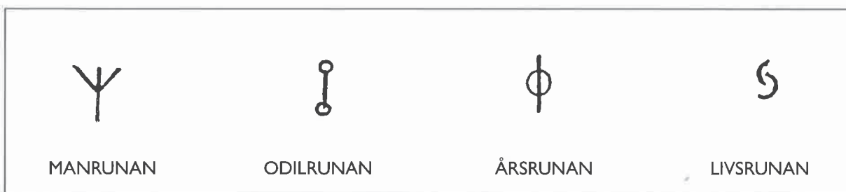
Figur 1 De fyra urrunorna efter Wirth 1939.

I ett brev till Curman sammanfattar Wirth resultatet av sina expeditioner. I avgjutningarna framträder ett antal