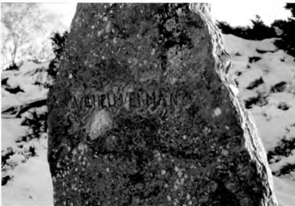
Figur 3. Minnstenen över Wilhelm Ekman vid gånggrift i Lunden. Foto Cornelius Holtorf 1999.

mellanneolitisk tid (ca 3200 f.Kr.). Graven ligger i en terrassering på en mindr höjd och är idag belägen på en höjd av 45 meter över havet. Landhöjningen i regionen innebär att gånggriften under neolitisk tid legat åtskilligt närmare havet, på en nivå av ca 25 meter över havsytan (Enqvist 1922: 54, 57-59). Spår av neolitisk bosättning finns bortåt 200 meter från graven, och bosättningens lokalisering till öns inland antyder att både åkerbruk såväl som fiske varit de avgörande näringsfången i dåtiden (Persson 1991).