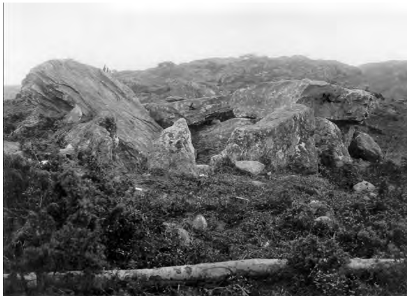
Figur 11. Gånggriften vid Lunden 1941.