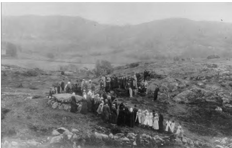
Figur 5. Antäckning av minnessten över Wilhelm Ekman.