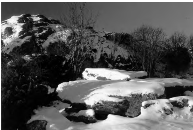
Figur 1. Gånggriften vid Lunden idag.

Monumentet är en ganska typisk gånggrift från tidig