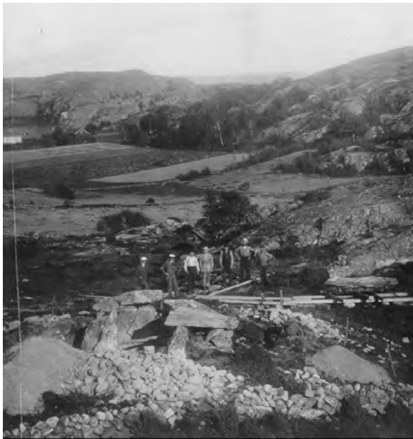
Figur 9. Gånggrift vid Lunden under utgrävning.