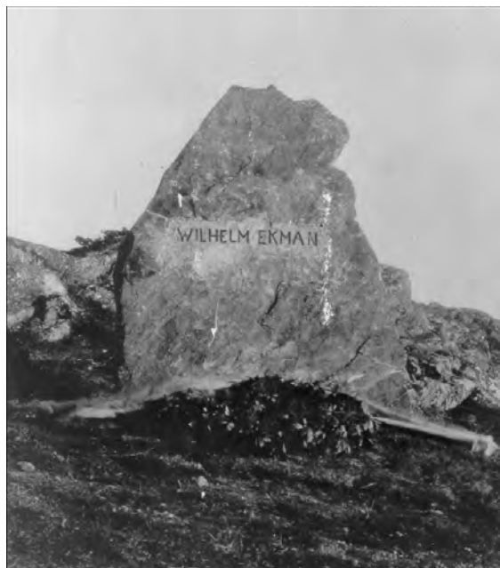
Figur 6. Minnestenen över Wilhelm Ekman, rest invid gånggriften vid Lunden 1915. Foto taget i samband med avtäckningen och kransnedläggning.

Figure 6. Memorial for Wilhelm Ekman at Lunden, in 1915. The photo was taken at the time of the unveiling of the memorial with deposition of a wreath.