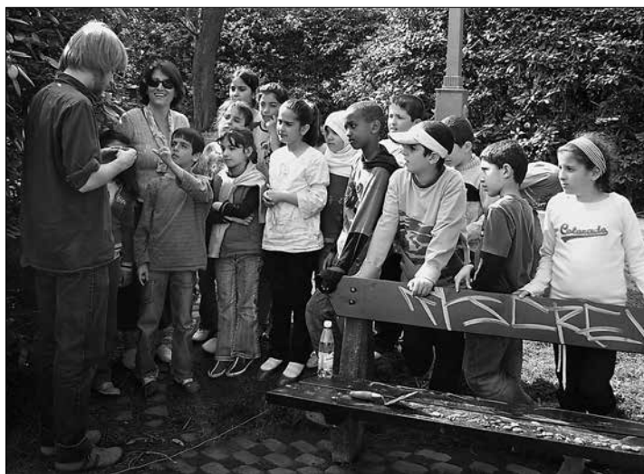
Figur 4. Förmedling och pedagogisk verksamhet är en självklar del av samtidsarkeologin. En skolklass från Bergsjön får lära sig mer om arkeologi i allmänhet och parkeologi i synnerhet.

Vid en granskning av sociotopkartorna över Göteborg blir det tydligt att dessa inte innehåller några negativa värden. Istället beskrivs områdena uteslutande genom positiva värden. Vi vänder oss emot att de negativa aspekterna av platserna inte kommer fram eftersom helhetsperspektivet därför går förlorat. Ett framtida arbete för Parkeologiprojektet skulle kunna vara att med hjälp av arkeologiska metoder genomföra en större kartläggning av samma områden som sociotopkartorna beskriver. Vi vänder oss också mot ett okritiskt användande av begreppet