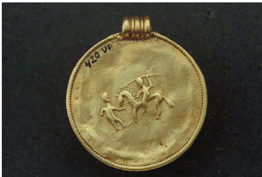
Figur 6. Medaljong av guld från Tunalund, Hjälsta sn, Uppland. Baksidan visar en ryttare och en bågskytt, möjligen på skidor. Romersk järnålder. Foto Ulf Bruxe, Historiska museet. Creative Commons Erkännande 2.5 Sverige (CC BY 2.5 SE)

att platsen hade hög status redan under äldre järnålder (Andrén 2020; Vikstrand 2001, s. 166, 188, 413; Andersson 1997, s. 237; Zachrisson 1997a, s. 173).