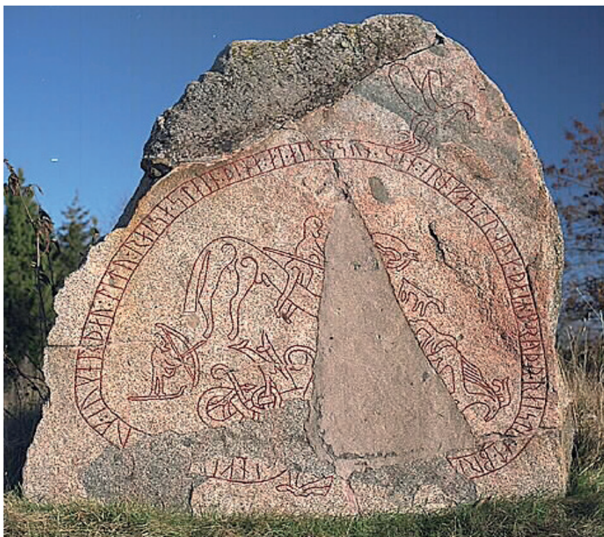
Figur 5. Runsten vid Böksta, Balingsta sn, Uppland, omkring 1050 e.v.t. En skidåkare med båge står nere i vänstra hörnet. Foto Bengt A. Lundberg, Riksantikvarieämbetet. Creative Commons Erkännande 2.5 Sverige (CC BY 2.5 SE)

till häst med ett spjut samt en annan man, som har en båge i sin ena hand och en stav i sin andra. Han är något större än ryttaren, och står på en linje, "steht auf einer ansteigenden Standlinie" (Hauck, Axboe et al. 1985a, s. 330). Kent Andersson skriver om "en figur med en pilbåge eller möjligen en stav i handen ... mannen tycks stå på ett par skidor ... en lokal hövding ... (eller) ... en allegorisk figur som ... visar att ryttaren besegrat en stam eller grupp som använde sig av skidor?" (Andersson 2020, s. 49).