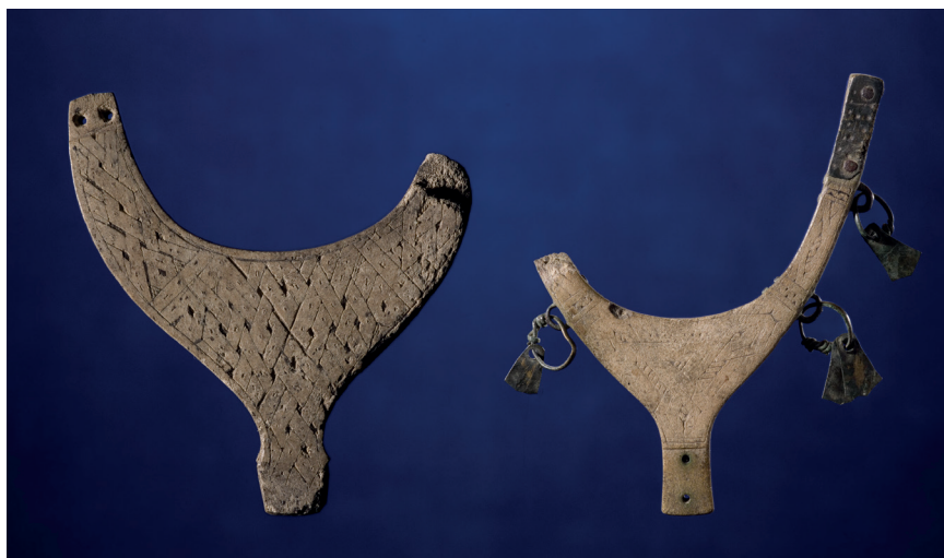
Figur 4. Två föremål av horn, ornerade med flätbandsmönster, från Vestvatn i Misvær och Eiterjord i Beiarn, Nordland, Norge, vikingatid-tidig medeltid. https://www.unimus.nol/felles/bilder/web_hent_bilde.php?id=14291664&type=jpeg Foto: Adnan Icgic ©2020 Tromsø Museum, UiT / CC BY-NC-ND 3.0. Fotot tillgängligt (open access) genom de norska landsdelsmuseernas databas, http://www.musit.uio.no/artefacts/tmul/search/?oid=27677&museumsnr=Ts6251&f=html .

täljstensföremål kom fram, bland annat tio skaft till grytor, varav sex ornerade, tre på vardera platsen; de är snarlika de långsmala skaften från Arjeplog sn.