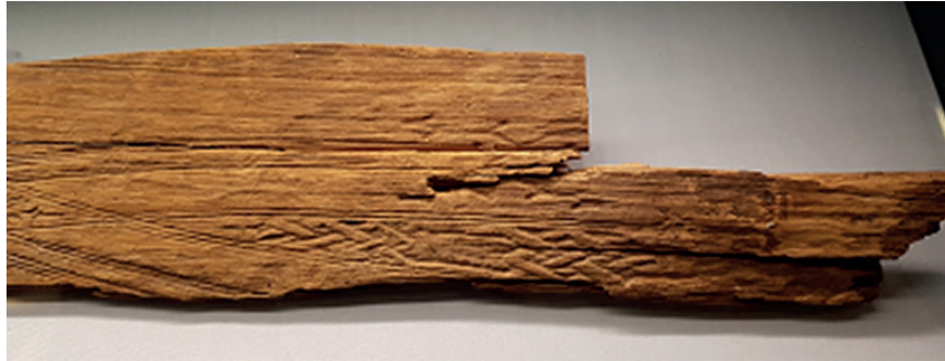
Figur 1. Skidan från Brännbacken, Arjeplog, Lappland.

Samer var berömda skidtilverkare, troligen redan på järnåldern. En man har under vendeltid (550–750 e.v.t.) begravts vid stranden av Stora Drocksjön, i gränstrakterna Härjedalen-Hälsingland, med sju små hyveljärn, lämpliga för att hyvla trä till skidor. Fynd av det här och liknande slag betraktades först som depåfynd, innan man insåg att det rörde sig om gravar (Sundström 1989, s. 23–30; Holm 2016).