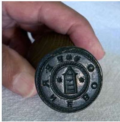
Figur 6. Stampen till Österfärnebos sockensigill stals 1813, samtidigt med kyrksilvret, men kom tillbaka 1956 och är åter i församlingens ägo.

Idén om att Barbara kan ha varit Österfärnebos kyrkohelgon har på senare år förts fram av ovannämnde Tord Andersson, samme forskare