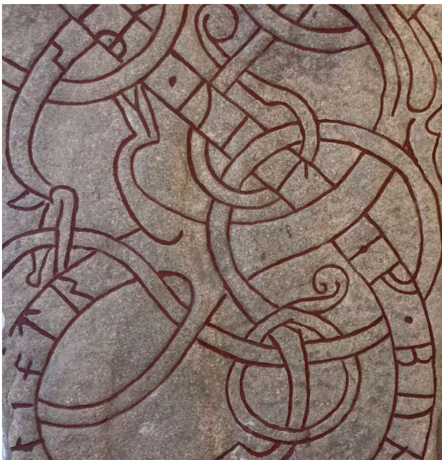
Figur 2. Önjut ristade denna runsten (Gs 1), som sannolikt ursprungligen stått på Vilevs grav på den första kyrkogården. Hans änka, Snöläg, lät resa den. Stilen daterar stenen till ca 1070–1100. Den står nu i kyrkans vapenhus. (Detalj.)

där, men sedan under tidernas lopp flyttats hit och dit. Den är starkt nött och kan inte dateras med hjälp av någon inskription. Texten har tidigare för övrigt betecknats som en nonsensinskrift, det vill säga att en icke-runkunnig person velat efterlikna runor (GR). Å andra sidan är den i fråga om material och storlek snarlik Gs 2 och att den en gång varit en parsten eller pendang till denna är en möjlighet att räkna med.