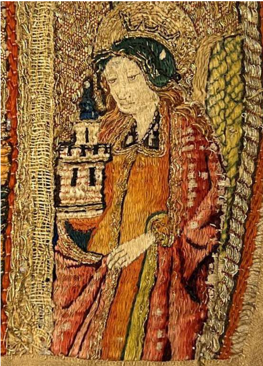
Figur 5. Mässhake från Österfärnebo (detalj). Här avbildas Sankta Barbara dyrbart klädd i rött, grönt och guld. Hon bär en krönt huvudbonad med bakgrund av en gloria. Hon sveper mantelfällan runt sitt attribut, tornet, som är krenelerat och försett med tre fönster. SHM inv. nr 5302.