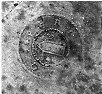
Figur 7. Österfärnebos sockensigill i papper och vax i mantalslängd från 1633. Äldsta belägg för användandet. Österfärnebos kyrkoarkiv, Landsarkivet, Härnösand.

som först uppmärksammade prosten Wittinghs omnämnande av Sankta Barbara (1971; 2011). Enligt muntlig uppgift av Bengt Ingmar Kihlström (i Andersson 2011) var också denne framstående kännare av medeltida kyrkoliv benägen att se Barbara som Österfärnebos patronus. Också i kyrkans informationsbroschyr, utgiven av ärke-