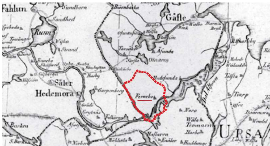
Figur 1. Österfärnebo ligger vid nedre Dalälven och i sydligaste Gästrikland. Närmaste grannsocknar är i norr Torsåker och Årsunda, i öster Hedesunda, i söder Nora och i väster By. Bildunderlaget är en landskapskarta från ca 1795.

batter i sockenstämman togs 1796 beslut om en ny kyrka. Men kort därefter drabbades bygden av flera missväxtår och därpå utbröt ryska kriget. Bygget drog ut på tiden. Det var i stort sett klart 1822 men invigningen kunde äga rum först 1827. Den medeltida kyrkan fick stå kvar strax intill den nya till 1830, då den revs.