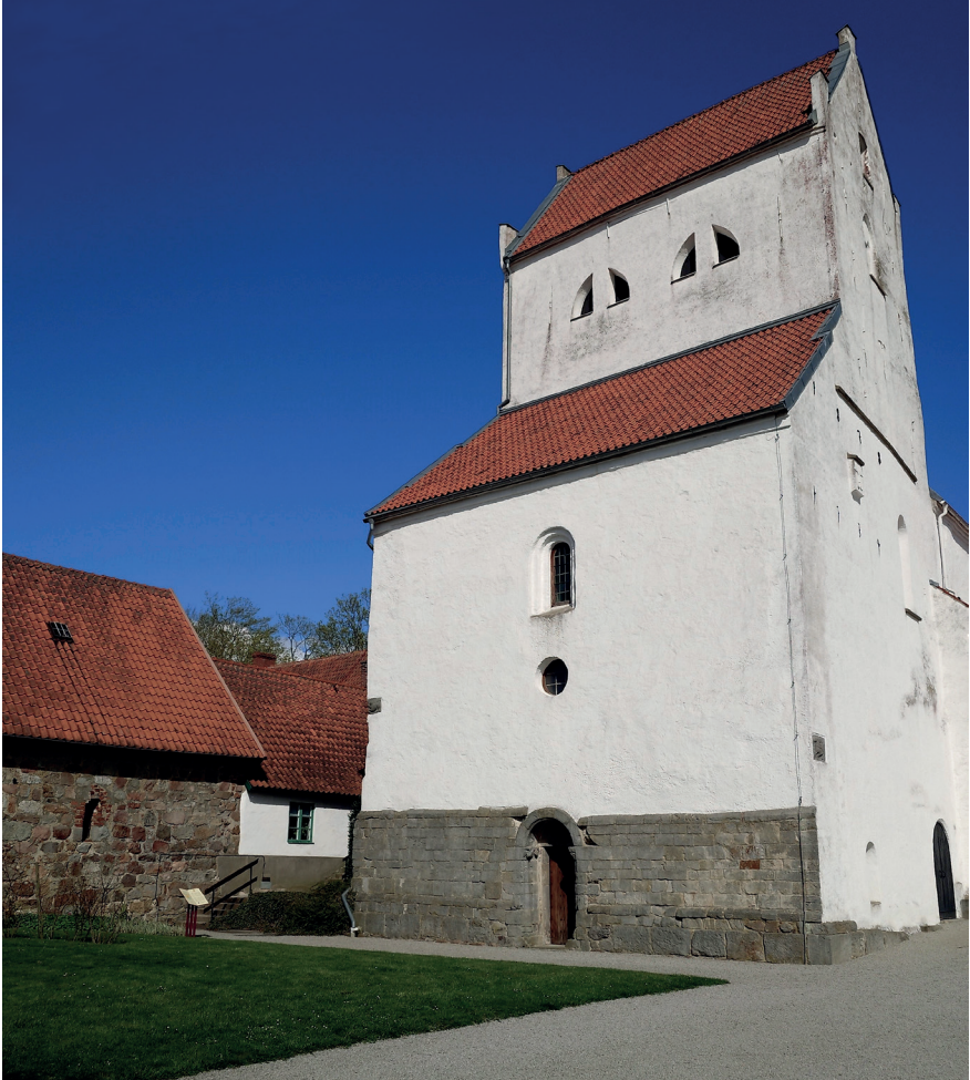
Fig. 4. Dalbys västtorn. Den numerade igenmurade högt sittande västportalen finns bakom det runda fönstret. Var detta en ingång till en kunglig loge eller hade tornrummet en funktion kopplad till klostret? Bilden är tagen ungefär där den södra längan en gång fanns. På bilden syns även en del av en medeltida byggnad som möjligen kan ha varit den norra längan i ett atrium (Wienberg 2010, s 30).

stämmer väl in på diskursen kring västtorn.