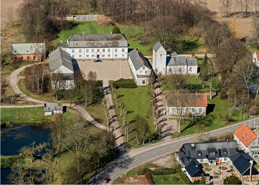
Fig. 5. Stora Herrestad kyrka med ett gårdskomplex i väster. Det såg kanske inte såg ut exakt så här på medeltiden men sätesgården från 1700-talet antas ha en medeltida föregångare. Intressant är hur längorna orienterar sig mot varandra, inte mot kyrkan som fallet är i Dalby.

hem medan en stenkällare intill S:t Jørgensbjerg i Roskilde ses som en stormansgård i stället för ett kloster, trots att ett sådant nämns i skriftliga källor (Stiesdal 1980, s. 167; Andersen & Nielsen 2000, s. 121–143; jmf. Nyborg 2004, s. 127; Wienberg 2010, s. 22). Återigen försvinner de alternativa tolkningarna i en diskurs som fokuserar på den världsliga makten.