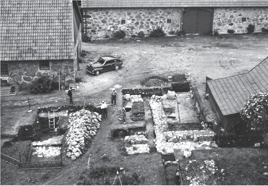
Fig. 1. Utgrävningen av den västra längan, sedd från kyrktornet mot väster. Här syns kalkstensplattorna framför murarna (Andersson 1970).