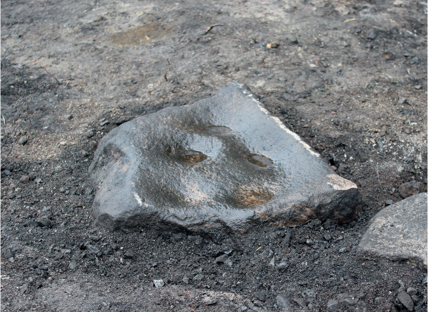
Bild 2. En av bokningsstenarna låg på hyttbacken, sannolikt på den plats där den använts.