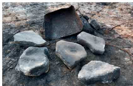
Bild 1. Fem av de bokningsstenar som påträffades vid undersökningen av Dammens hytta tillsammans med ett fyllfat som använts för att bära kol eller järnmalm.

Trots att verksamheten pågått under så pass lång tid var spåren på platsen förvånansvärt få. Endast rester av ett par enkla skjul för förvaring av järnmalm hittades. Fyndmaterialet var mycket sparsamt och bestod av enstaka keramikskärvor, kritpipor och djurben. Däremot hittades en stor mängd så kallade bokningsstenar (bild 1). Själva masugnen förstördes helt då järnvägen drogs fram på 1870-talet och en kättingsmedja och en såg byggdes på platsen. Aktiviteterna vid hyttan företogs sannolikt bara i perioder när det fanns tillräckligt med vatten för att driva bälgarna vilket gjort att man inte varit i behov av några mer permanenta byggnader, förutom masugnen.