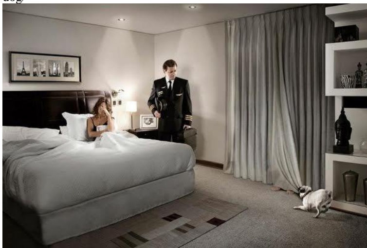
Imagen 4. Campaña Bad food, bad dog.

En este anuncio, donde también hemos borrado la marca, el perro muestra al presunto esposo que acaba de llegar (pues aún no se ha quitado el uniforme de trabajo), la infidelidad de la mujer, al tirar de la cortina y descubrir los pies desnudos del amante. La interpretación según la cual el esposo estaría a punto de salir quedará descartada al decodificarse correctamente el texto, cuya clave interpretativa son los pies desnudos detrás de la cortina.