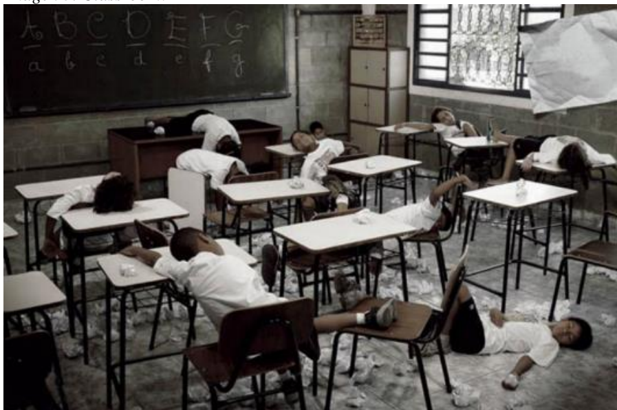
Imagen 3. Classroom.

Intervinimos la imagen 3 y borramos la pequeña referencia verbal a la marca y la escueta descripción del producto, para entonces preguntarle al lector: ¿Qué significa esta foto? ¿Qué clase de producto anuncia? El significado denotativo, referencial, es evidente: grupo de niños en el piso de su salón de clases, aparentemente muertos. En un contexto histórico marcado por frecuentes matanzas en escuelas estadounidenses, el receptor podría inclinarse a pensar, en una primera percepción, que se trata de una fotografía de un asesinato colectivo. De hecho, uno de los comentarios en la web de www.adsoftheworld.com señala: "i just saw a room of dead kids, but it's okay, they're just bludgeoned to sleep. however, it is thick paper so you're selling to people who are already very sick like us. ... think, think, think ... okay dead kids might sell paper. Sneakyhands". Otro comentario señala: "Mmmmm, this ain't right... heavier paper... knocks your ass out... right... heavier paper, so much more funnier (sic) ways to say this. OFF COURSE IT'S FUN... but this ain't right" 18 .