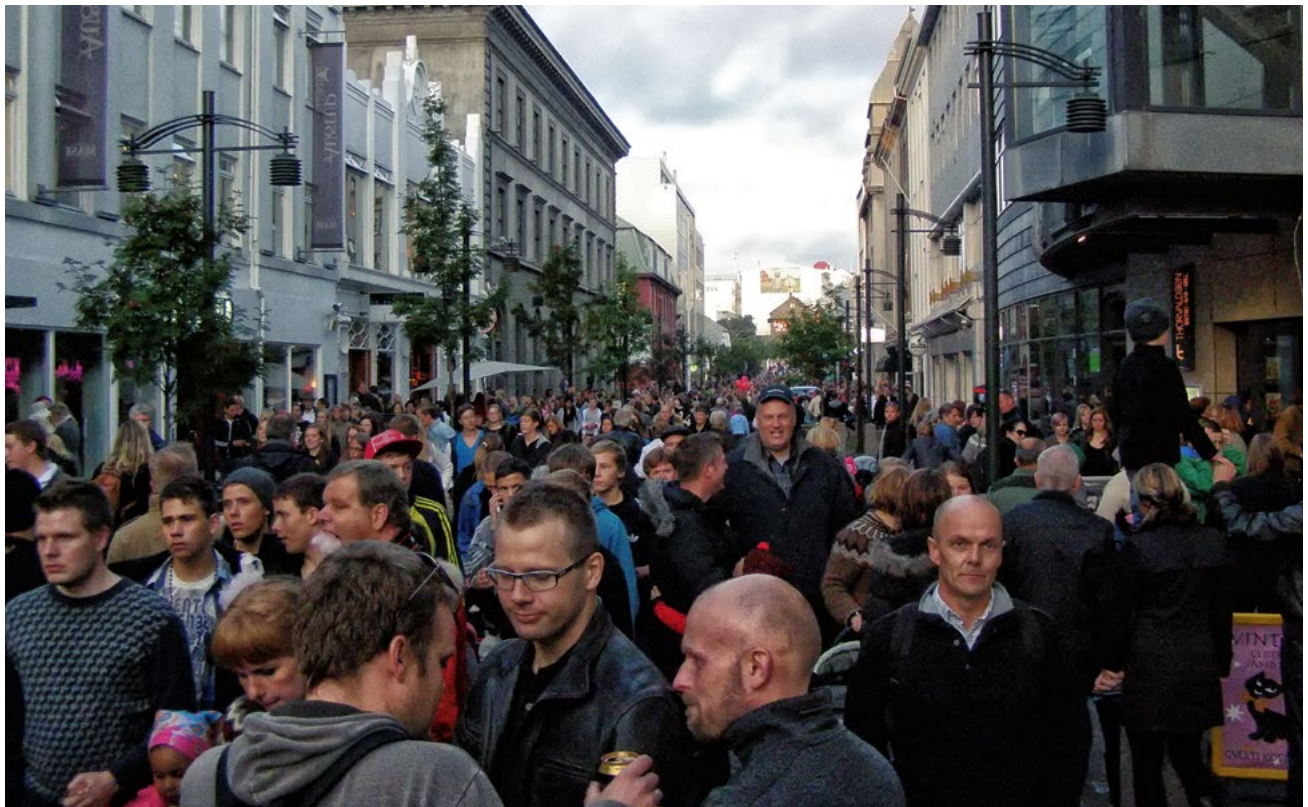
Fig. 2. Crowded streets in central Reykjavik, Menningarnott 2011.

Large celebrations are often complex and costly operations, therefore dependent on institutions of some kind, such as families, guilds, associations, private companies, towns and states. In Europe, the Christian church for a long period of time was by far the most prominent festival organiser. It provided not only a common language and terminology, such as all the derivations of the Latin festā and the causes for various religious and popular festivities, but also often controlled contents, organisation, venues, economy and audience. This has had long-lasting consequences for the naming and overall formatting of large festivities in Europe. The many diverse forms of celebrations, and the many differences between old and new forms notwithstanding, there are still important similarities and continuities over time that should not be underestimated, for example in terms of ritual behaviour, expressive forms, calendar, communality and spiritual meaning (Young 2001:506).