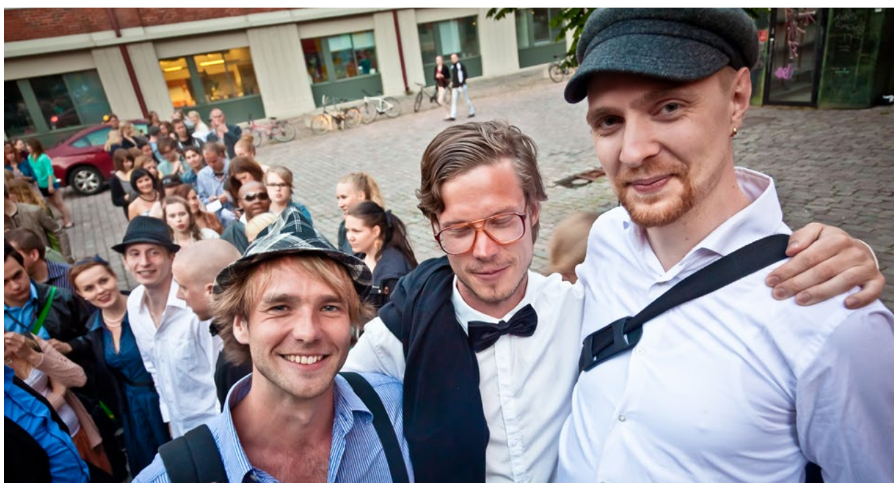
Fig. 2. People queuing to get in to the 2012 WLH Midsummer event.

The gender-defined behaviour, where men are expected to be polite towards women, is not only about courtesy or chivalry, but also a form of action that on a certain level reaffirm conservative power relations between genders. Although it may be pleasant on a personal level, gentlemanly behaviour, according to psychologists Connelly & Heesacker (2012: 438) includes connotations of male domination and protection, perpetuating “gender inequality at the structural level”. This “benevolent sexism” (Glick & Fiske 1996), idealises women who conform to feminine norms. As a woman at the 2013 New Year’s Eve dance declared, she enjoys the WLH events because there “a woman is allowed to be a woman” (field notes 2013-12-31). I did not enquire more specifically as to what she meant by this, as the crowded celebratory space was not really suitable for an in-depth conversation on gender roles, but it is evident that as women at the events are dressed as 1950s “ladies” and men as “gentlemen”, a certain heteronormativity is also evoked. Although, compared to traditional pavilion dances, the WLH events have no apparent gendered regulations regarding who can initiate the dance, the events risk restoring conservative roles through their quest for these gendered roles.