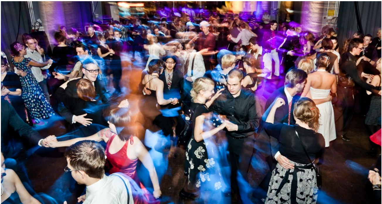
Fig. 1. Couples dancing at the 2010 New Years' Eve "Iskelmä Dance" at Korjaamo, Helsinki.

suggestive behaviour further increases the ambiguity. Adhering to Bateson's theory, if we incorporate the DJ and the recorded music into the equation, the play message is transformed into a question, "is this play?" (op. cit. 182). Here attention is drawn to the representational value of the ultimate message: "Not only does the playful nip not denote what would be denoted by the bite for which it stands, but, in addition, the bite itself is fictional" (ibid.). Bateson (op. cit. 183) likens this kind of communication to "art, magic and religion", which I interpret to include ritual and other behaviour where what is denoted in the end is of abstract and representational value. In Bateson's (ibid.) own example, this includes poker players' "addictive realism" that equates "the chips for which they play with dollars". It is in this field that the DJ operates, between the representational romance of the records and the realism of the dance. The DJ's incitement to realise the romance represented on the records does not denote what a pursuit of romance in itself would denote, and the actual romance is itself also fictional and only represented on the records. In general terms, the DJ is constantly repeating the question, "is this play", which emphasises the possibility of romantic pursuits but does not place any expectations or demands.