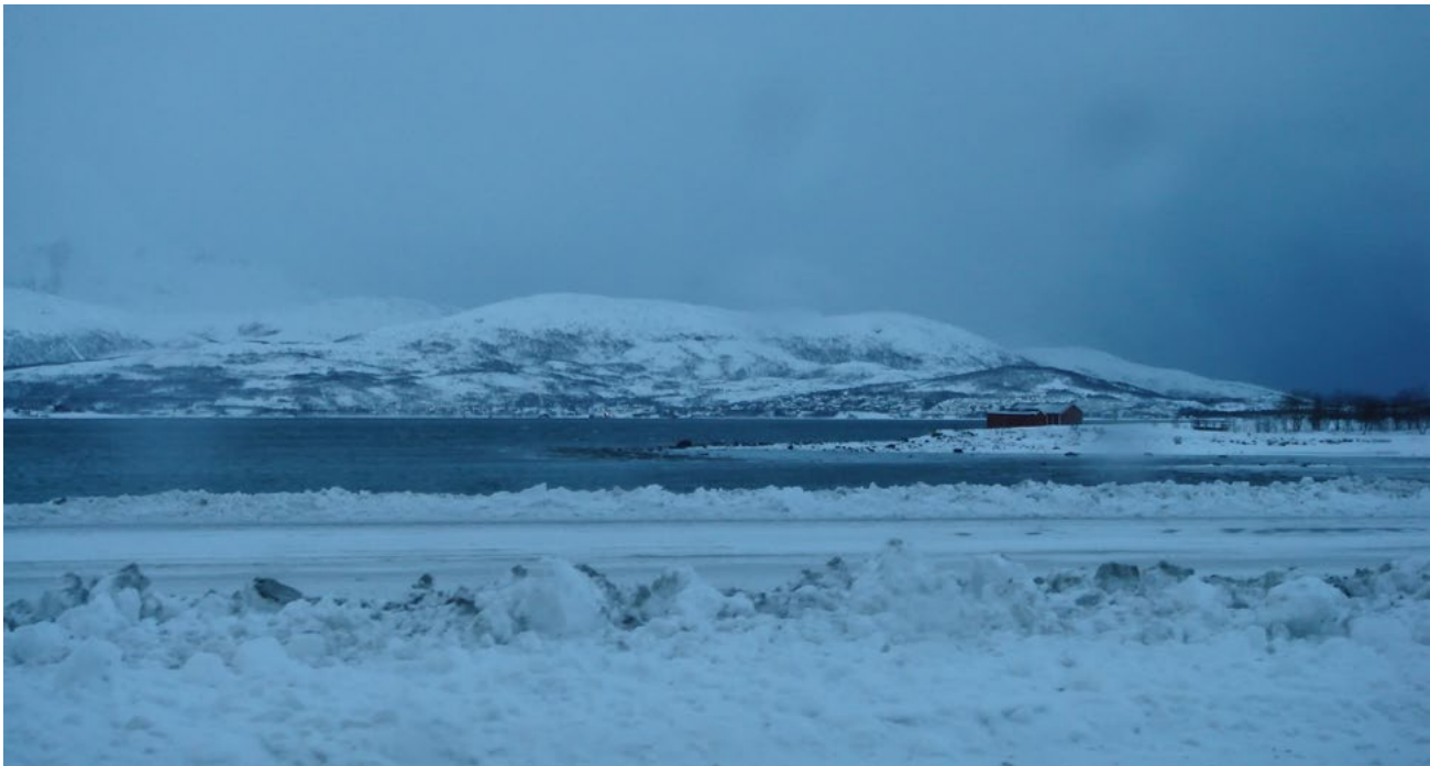
Fig. 2: Northern Norwegian landscape.

land rights struggles pursued through the legal systems of the nation state and the European Union. These are the landscapes that have enthralled ethnographers, tourists and Disney alike. The environment is a second frame to which I now turn. Environmentalism also transcends national borders.