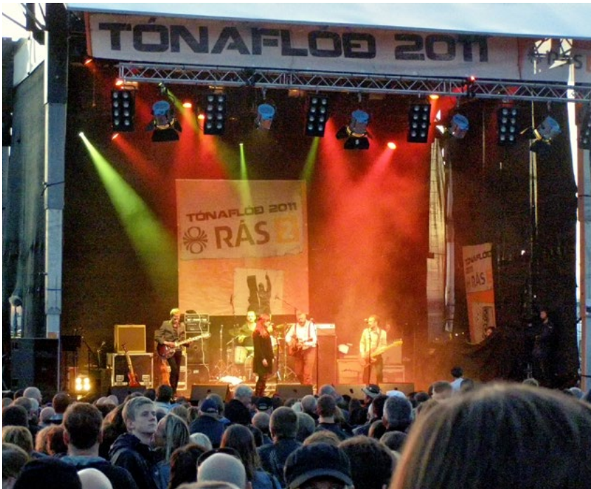
Fig. 3. The central stage in Arnarhóll park, Reykjavik, Menningarnott 2011.

to many different artists, to foods and goods from distant places, as well as to meeting old and making new friends. For the arrangers, all types of cultural events are risky undertakings, especially in northern Europe, where so many large events are held outdoors during short and rainy summers. But by presenting several kinds of artists, attractive to different types of audiences, it may be possible to manage risks more efficiently and at the same time reduce the total costs per performance. As PR, advertisement and media have become key factors to success, the possibility to concentrate communication efforts on a single and short event is also highly profitable. Such focused attention is in turn likely to attract more easily sponsors and commercial partners. To the artists, festivals are a means to reach larger audiences with the same investment, to concentrate activities to a limited period of time, and thereby to avoid many of the hazards and inconveniences encountered in protracted solo tours. In this light, the increase in numbers of festivals can be understood as an answer to the growing demands of the market economy for maximisation of profit and continuous rationalisation and increased effectivity in the field of expressive culture.