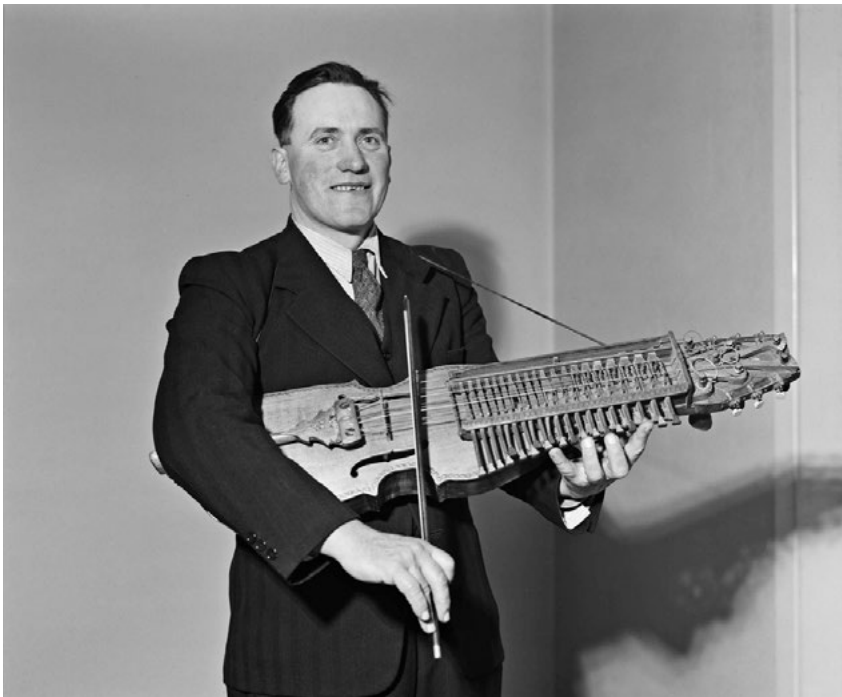
Fig 1. Eric Sahlström i början av sin karriär som framträdande nyckelharpspelare, korrekt klädd i mörk kostym. Senare skulle folkdräkt bli hans givna konsertklädsel. Östlings foto 1949. Foto i Upplandsmuseet.