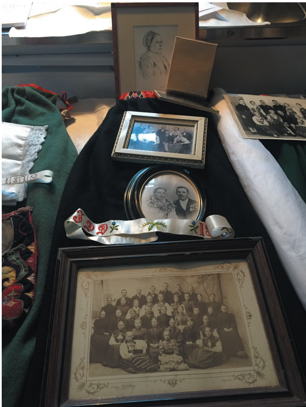
Exempel på material från Knisgårdens gårdsarkiv, Leksand, som studenterna fick arbeta med under kursen.