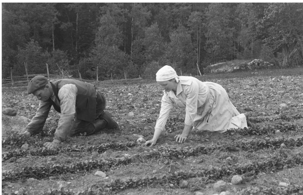
3. Jordbruket krävde långt in på 1900-talet mycket manuellt arbete, både för kvinnor och män. Rensning och gallring av rovor. Svinhults socken, Östergötland 1920.

kvinnor i hushållet. En bidragande orsak var säkerligen att behovet att komplettera hushållets arbetskraft inte var lika stort. Positionerna var redan intagna. En ingift kvinna skulle konkurrera med sin svägerska, en ingift man med sin svåger. Därmed understryks sambandet mellan äktenskap och syskonskap. I artikelns nästa del ska denna relation belysas mer utförligt, men först ska syskongårdarnas storlek kommenteras.