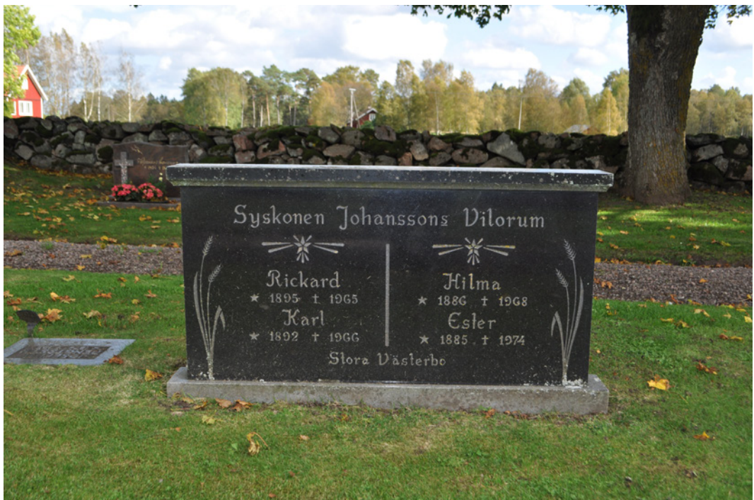
1. Gravvård över fyra syskon. Jäla kyrkogård, Västergötland.

1990-talet väckte en serie program med bröderna Erik och Sigvard Gustafsson i småländska Hågeryd uppståndelse. Avsnitten samlades senare till en TV-film – Erik och Sigvard: ett år i Småland – numera allmänt tillgänglig via SVT:s öppna arkiv. Berättelsen om brödernas liv på släktgården utanför Växjö skildrades senare i både tidningar och böcker, främst med utgångspunkt i deras ålderdomliga livsföring. Medan 1900-talets jordbruksutveckling präglades av omfattande mekanisering framstod deras jordbruk, med hästkraft och handmjölkning, som en kvar-