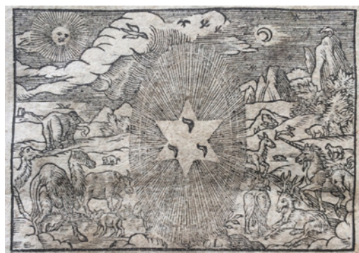
2. Mores illustration av 1 Mos. 1.