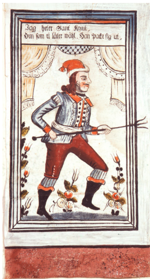
11. Dörrväktare.

Att äldre bruk överlevde länge illustreras kraftfullt av Pleijels uppgift att sockenborna i en dansk by brukade buga eller niga för en tom vägg i kyrkan. Först vid en restaurering av kyrkan kunde detta märkliga beteende få sin förklaring då det visade sig att det på den platsen i förreformatorisk tid hade funnits en nisch med en bild av jungfru Maria.