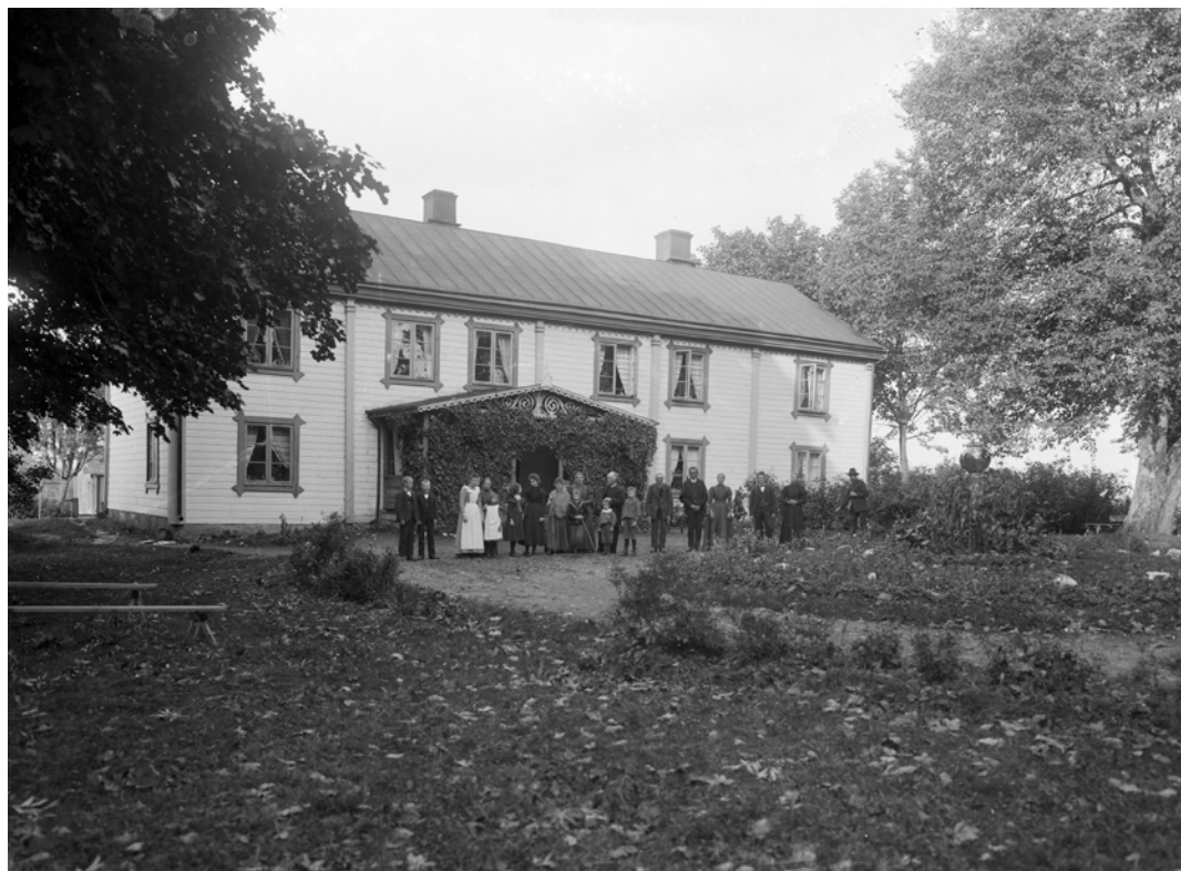
4. Bandet mellan gården och släkten förstärktes på flera sätt under 1900-talets första hälft. Det kunde, som här, manifesteras genom fotografier av familjemedlemmarna uppställda framför mangårdsbyggnaden.

fastrar och barnens farfar. På mindre än ett år gick dock farfadern, en faster samt modern i familjen bort, händelser som dessutom lämnade den kvarvarande fastern sjuklig. På grund av detta fick syskonen – då mellan två och sexton år – ta ett mycket stort ansvar med arbetet på gården. Efter att den äldsta system flyttat för att börja studera till lärare fick Klara som femtonåring överta huvudansvaret för hushållet, men också för de yngre syskonens uppfostran. Att den äldsta system följde sin livsdröm och lämnade familjen slog in en kil mellan syskonen; flera decennier framåt fanns en outtalad anklagelse mot att hon svikit de övriga. Klara träffade så småningom en man och förlovade sig, men kände att hon inte kunde lämna sina småbröder innan de vuxit upp. Äktenskapet fick därför anstå i flera år, och även efter giftermål och flytt till makens