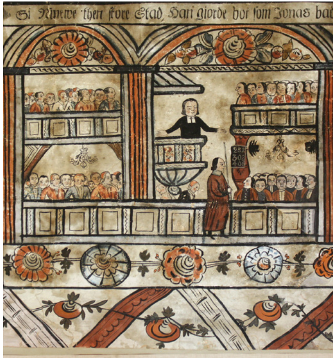
6. Detalj ur målning av Jufwas Anders Ersson 1812, idag i Ullvi bystuga.

Vad detta innebär är att dalmålarna levde med, läste ur och kunde recitera ett ansevärt textmaterial genom vilket även Bibeln kom med: evangeliets texter var nog ofta kända genom de "evangeliepsalmer" som sammanfattade och lade ut söndagens text (Olsson 1995:161). Det var inte heller ovanligt att man ägde en egen psalmbok, då man kunde få den i förlovningsgåva. Att den finns rikt representerad i dalmåleriet, även när motivet är hämtat ur Bibeln, bör därför inte överraska och ibland är det själva psalmboken som illustreras, som i de Leksandsmålningar som visar hur sockenbor sjunger under ledning av en ängel, med citatet ur Sv.Ps. 127:3: 14 "Thet himmelska härskap med höga röst be- gynte med Ängeln siunga."