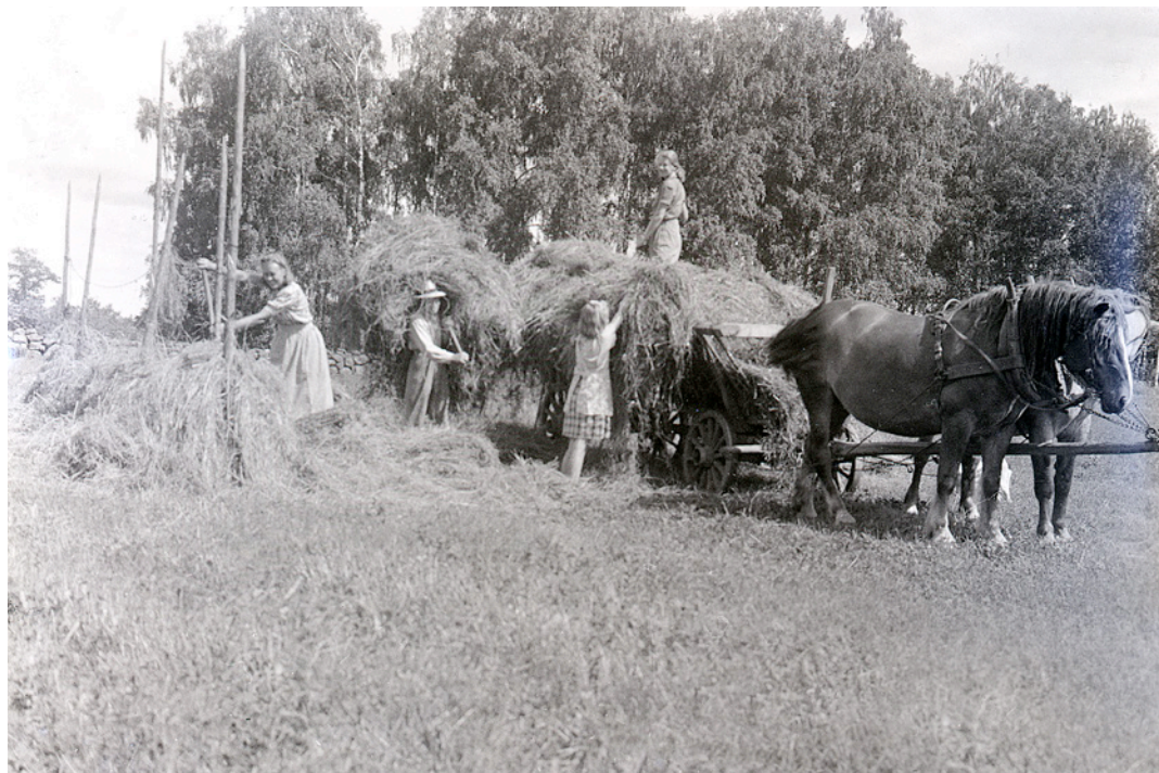
5. Jordbrukets arbetstoppar under sommaren har inneburit ett starkt behov av extra arbetskraft, vilket bland annat lösts genom att utflyttade familjemedlemmar hjälpt till på gården. Höbärgning i Ekby, Skaraborgs län, 1944.