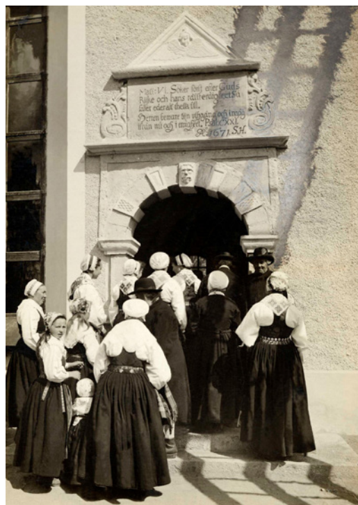
8. Leksands kyrkas brudport.

Kyrkan var kanske inte det enda rituella rummet där rituella handlingar utfördes. Den var dock obestriddigen epicentrum i en sockens liturgiska liv. De målade dalabönderna levde inte bara med psalmbok och figurbibel. De