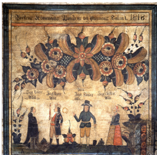
9. De tre lutherska stånden med tillagd kvinnlig representation.