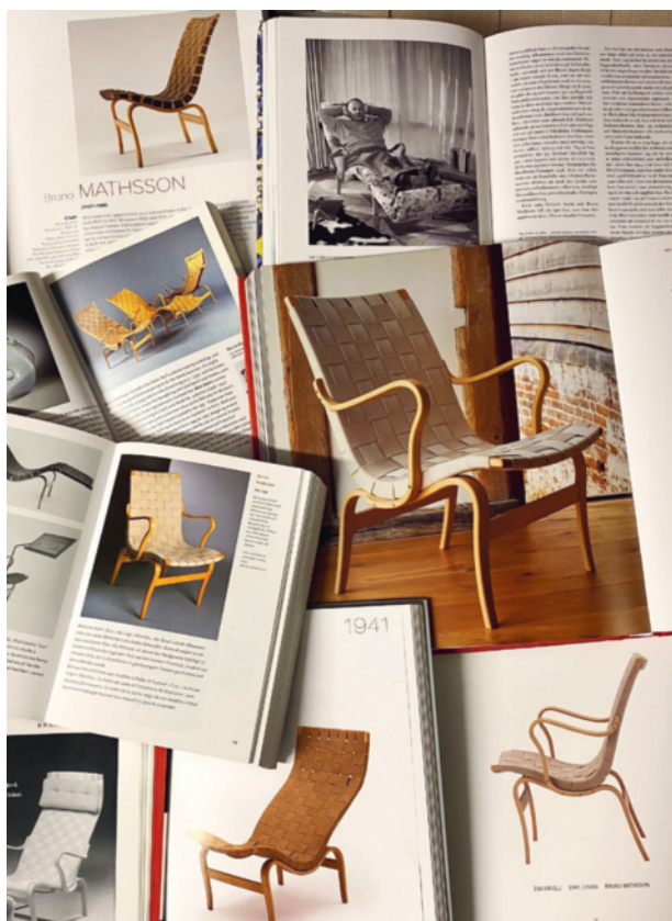
5. Några exempel på artiklar ur böcker som beskriver och visar Bruno Mathssons stolar.

Det finns åtskilliga böcker, både svenska och internationella, som ägnats åt Mathsson och hans gärning. Eva finns också med i många både möbel- och formhistoriska översiktsverk, avbildad i helformat, som detalj eller i närbild ( historieskrivning, bild ). I litteraturen kan man läsa om hur Mathsson, som femte generationens snickare (ibland anges sjätte), tog tåget regelbundet från Värnamo