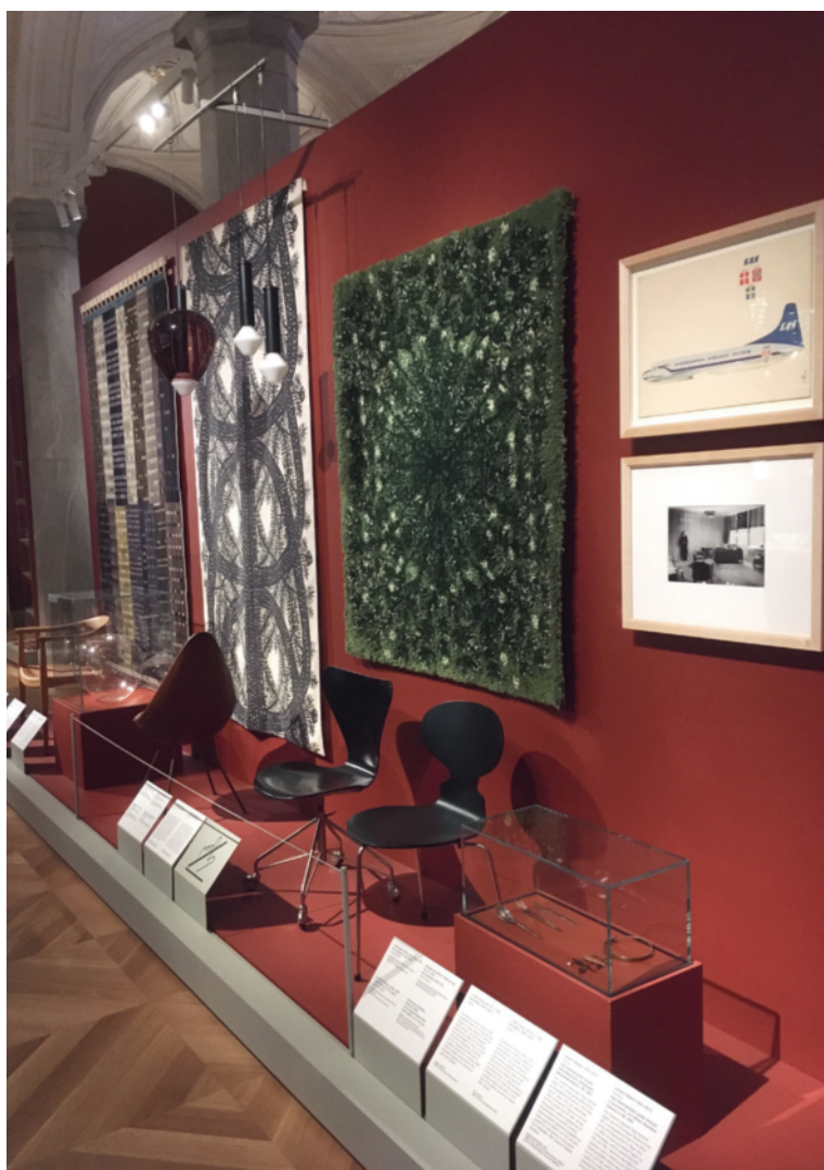
1. Bilden visar ett utsnitt från Nationalmuseums permanenta formutställning. Samtliga stolar kan betraktas som möbelhistoriens kändisar.

På bild 1 syns några stolar från 1950-talet av Arne Jacobsen, Droppen, Sjuan i kontorsstolsutförande 20 och Myran, på Nationalmuseums utställning Tidslinjen , som invigdes i Stockholm 2018 efter en omfattande ombyggnad. Stolarna är välkända för den invigde. Troligen även för personer som inte är det, åtminstone de två sistnämnda då de är väl spridda både i Danmark och Sverige. Enligt Nationalmuseum står objekten för det som