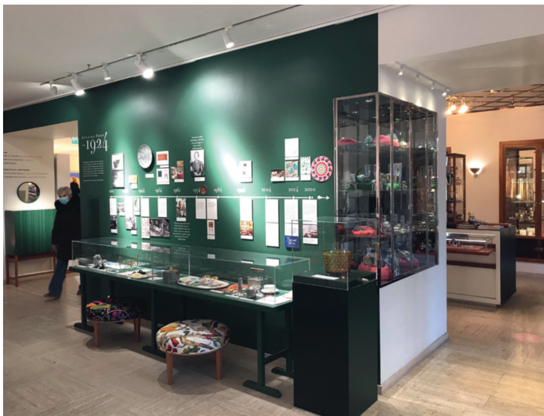
2. Utställning i inredningsbutiken Svenskt Tenn 2021 som exempel på hur kommersiella aktörer visuellt illustrerar den egna berättelsen med utstakad historisk tidslinje. Foto: författaren 2021.

Vi lever i en tid då vi ständigt blir påmind om klimatkris och världens ändliga resurser. Under senare år har hållbarhetsperspektivet med betoning på klimat och miljö blivit allt tydligare och synligare i medieringen av klassiker (Munch & Jensen 2021). 26 Det märks i annonsmaterial, företagspresentationer och produktbeskrivningar där möblernas begränsade fotavtryck lyfts fram. Möbeltillverkarna stärker sina varumärken genom att framhålla