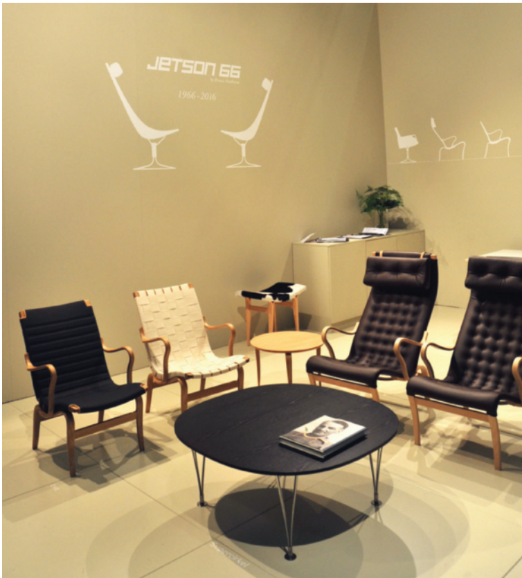
4. Här visas siluetter i en utställningsmonter på Stockholm Furniture Fair 2016 av Bruno Mathssons möbler som aktivt används i företagets kommunikation.

blivit internationellt kända. Det är också med Eva som han främst är ihågkommen (Sparke 1998:81). Ofta framhålls Mathsson som främsta representanten för Swedish Modern , en stilriktning som beskrivs som mer humanistisk och organisk, där naturmaterial används i större utsträckning än exempelvis inom den stramare tyska modernismen (ibid.). Stolen produceras av Bruno Mathsson International AB (under en period av Dux), ett företag som ligger i Värnamo, Småland, med en lång tradition av möbeltillverkning ( formgivare, prestige, historieskrivning ). Idag hyllas bygdens son på flera sätt i sin hemstad, bland annat genom två stolar i brons i fullstorlek på Storgatsbacken, en siluett av liggstolen Pernilla 3 i brons monterad på en husvägg på Bruno Mathssons plats och ett konstverk i aluminium föreställande samma liggstol vid Värnamo skatepark.