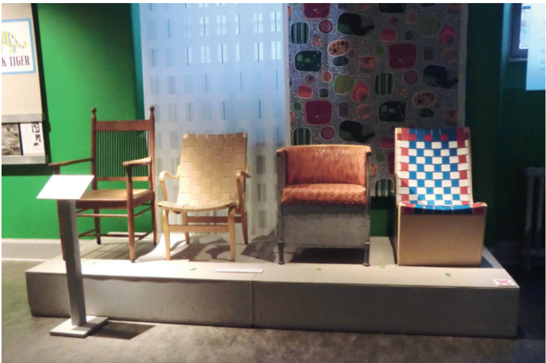
6. Stolexposé på Röhsska museet med stolen Eva som nummer två från vänster i bild. Foto: författaren 2012.

Eva möblerar många offentliga rum såsom bibliotek, museer och institutioner, däribland Malmö museer och min egen arbetsplats. Stolen finns även i tv- och läshörnor och i vardagsrum i svenska hem ( kontext ). Den går ganska lätt att hitta i inredningspress och i mäklarannonser – nu och tillbaka i tiden. Stolens karaktäristiska uttryck och symbol-