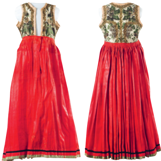
2. Livkjol från Listers härad i Blekinge i Nordiska museets samling, visad bakifrån. Liv av blommig sidenbrokad kantat med knypplad guldspets och sidenband, kjol av röd rask kantad med sammets- och sidenband. Rask är ett tunt köpetyg av ylle med vaxad yta och kan inte tvättas utan att förlora i utseende. Föremålsnummer: NM.0099151.

Svensson i Torstäva, som betalade över 11 riksdaler för detta praktplagg. 10 För att få ett begrepp om de ekonomiska proportionerna kan påpekas att bouppteckningens värdering av Ingrids hela och omfattande lösöre låg på 104 riksdaler, vilket är undersökningens fjärde högst värderade sterbhus.