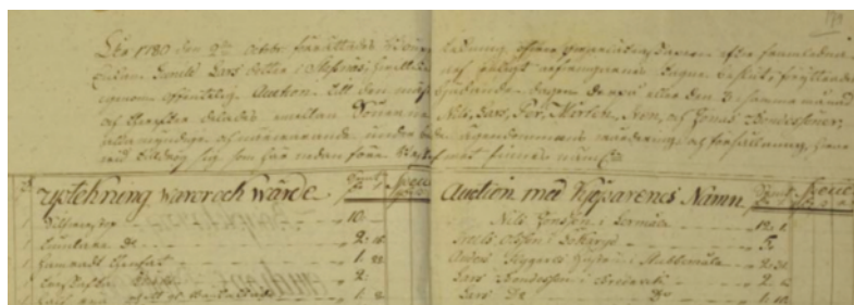
1. Bouppteckningsingress och inledning av auktionsprotokollet för Gunild Larsdotter.

Auktionerna innebar att ett hushålls lösöre skingrades bland grannar och på bygden, men det var långt ifrån alltid som sterbhusauktionen förde med sig att hushållet helt tömdes på föremål. På 15 av de 32 undersökta auktionerna ropades hela lösöret ut, men i mer än hälften av fallen var det alltså bara delar av lösöret som gick till försäljning. Här är en distinktion mellan de två formerna nödvändig: de förstnämnda benämns fortsättningsvis som fullständiga auktioner och de sistnämnda som partiella . De fullständiga auktionerna har i genomsnitt 102,5 utrop per auktion, att jämföra med 92,5 för de partiella. När auk-