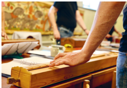
Här ligger psalmodikonet på ett bord för spelning.

Vid spel ligger psalmodikonet horisontellt på utövarens knä eller på ett bord. Dillners motto var att det skulle räcka med tjugo minuter för att lära sig spela. För att även de icke läskunniga skulle kunna spela psalmodikonet