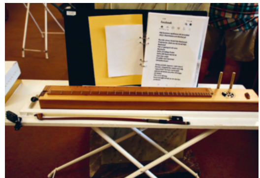
Psalmodikonet på specialbyggt bord gjort av en strykbräda.

Överhuvudtaget hade de psalmodikonspelande medlemmarna finurliga och genomtänkta lösningar för både spel och transport av psalmodikon; bland annat använde någon en fiolstråke för barn på sitt amerikanska psalmodikon och flera hade egenhändigt konstruerade tråklykor för att reglera så att stråken inte drogs snett på strängen. Andra lösningar involverade duschslangar som jag inte riktigt förstod vad de användes till.