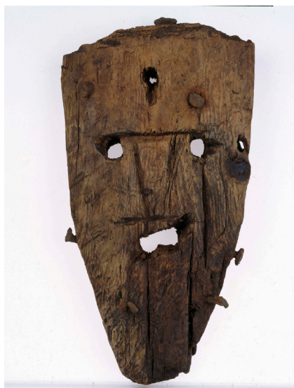
Fig. 3. Masken fra Stóraborg.

er kluntet og flad. Der er et mindre hul i panden og et ude ved kanten ved venstre øjenhule. Der sidder seks søm af jern i masken fordelt på sider, top og hage, de har formentligt været til fastgørelse af hår og skæg eller andet, så masken kunne bæres foran ansigtet. Masken er unik.