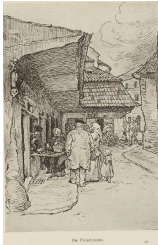
Bild 5. Die Fleischbänk i Prag Judenstadt.