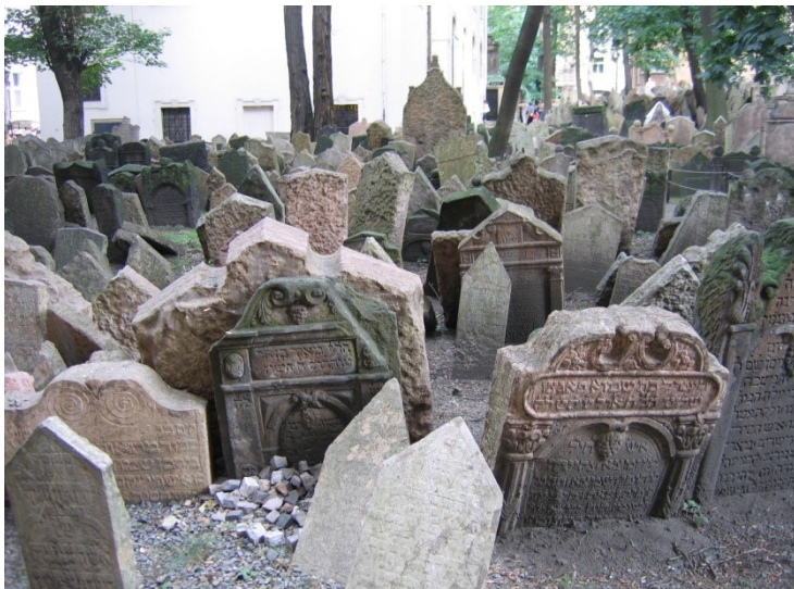
Bild 1. Gamla judiska begravningsplatsen i Prag.

En annan ovärderlig källa är det så kallade »stenarkivet«, det vill säga inskriptionerna på gravstenarna på de två gamla judiska begravningsplatserna i Prag (Bild 1). Dessa inskriptioner är på hebreiska.