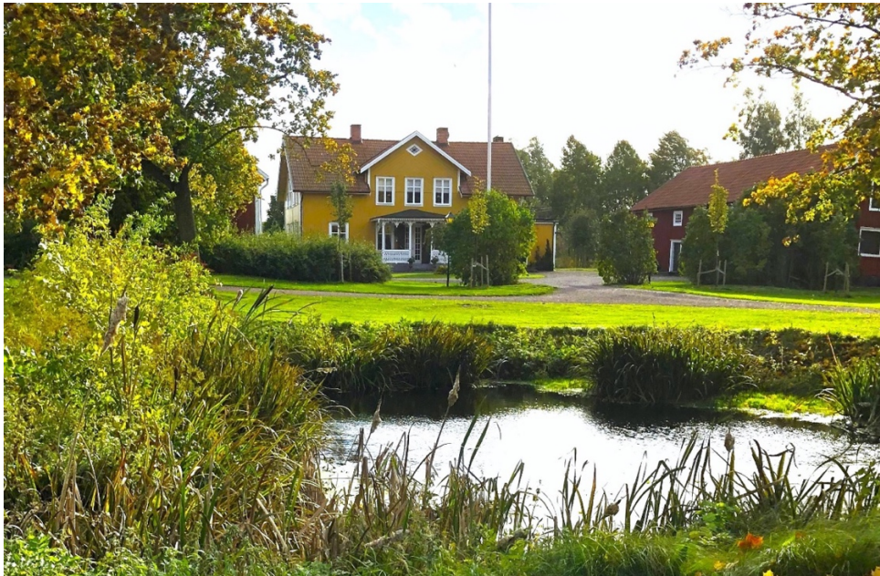
Bild 9. Valla rusthåll 2023, tidigare Magnus Gripenskölds säteri. Gården är inte identisk med det intilliggande Valla säteri.