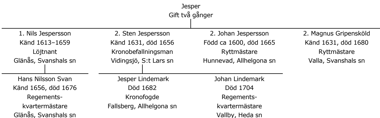
Tavla 1. Utredningens huvudpersoner och släktbanden dem emellan.