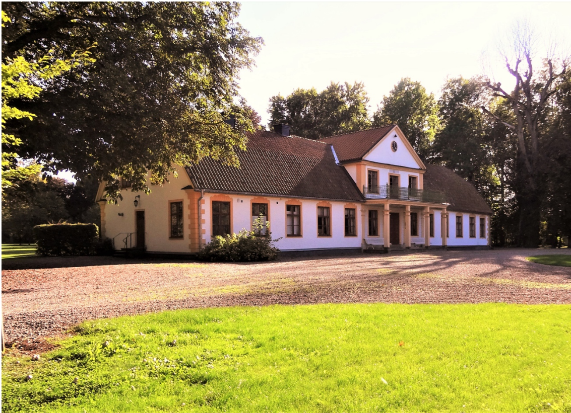
Bild 10. Hunnevads säteri 2022 utanför Skänninge heter numera Lindevads säteri. Den nuvarande huvudbyggnadens äldsta del uppges vara från sent 1600-tal.