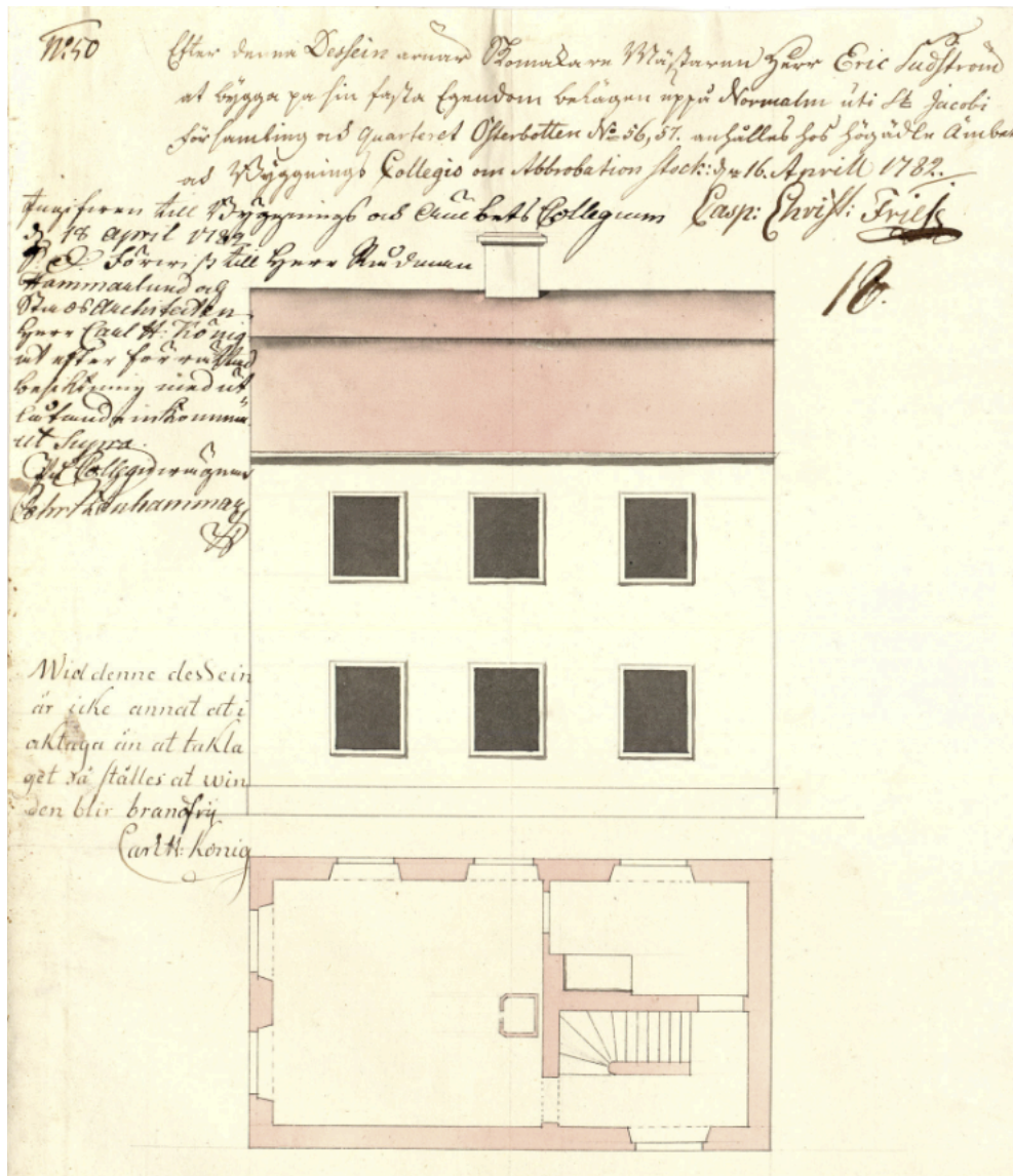
Bild 1. Fastigheten Österbotten nr 56 i Stakens gränd i Johannes församling i Stockholm 1782.