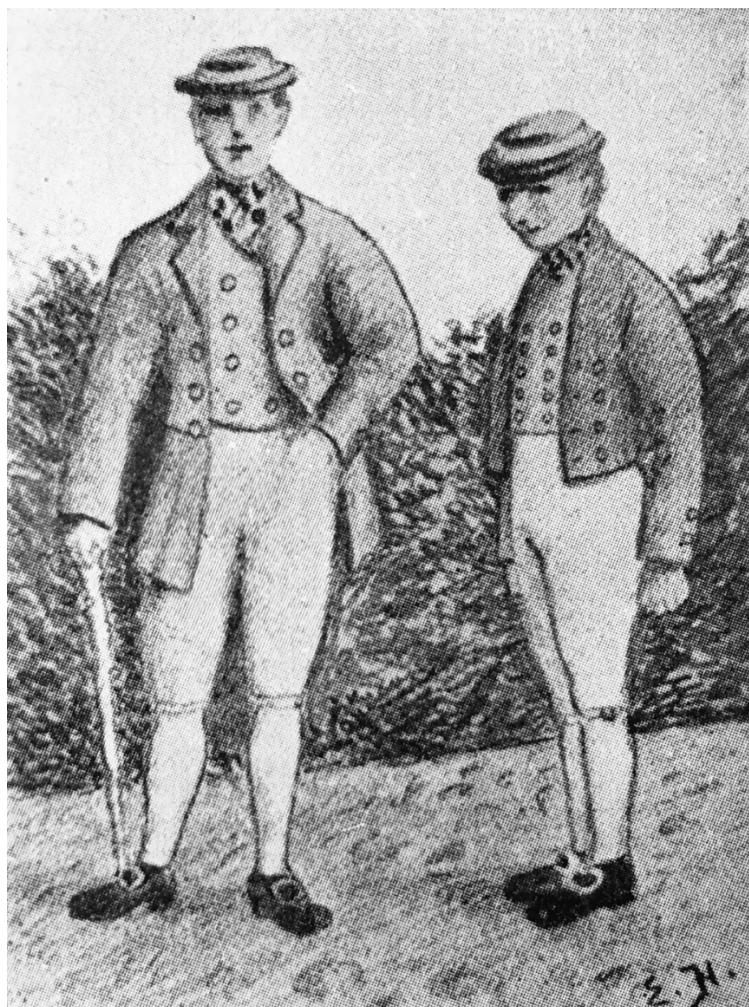
Bild 4. Skoldag på Gustafsbergs barnhus 15 november 1776.