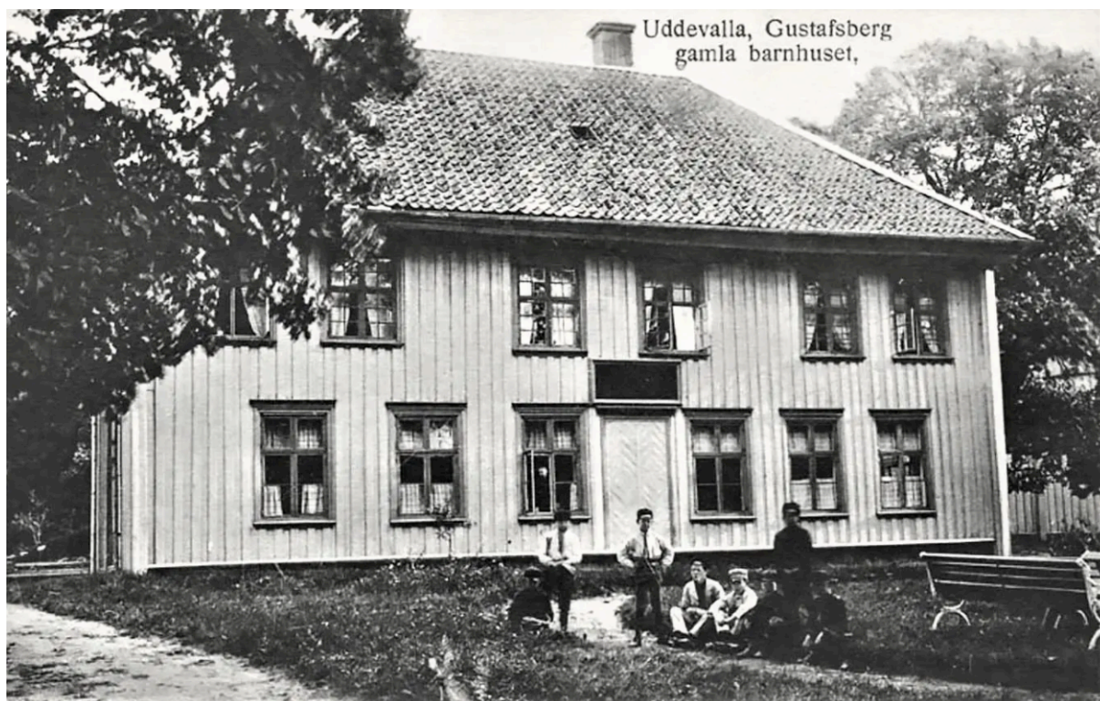
Bild 2. Gustafsbergs barnhus uppfört 1770.