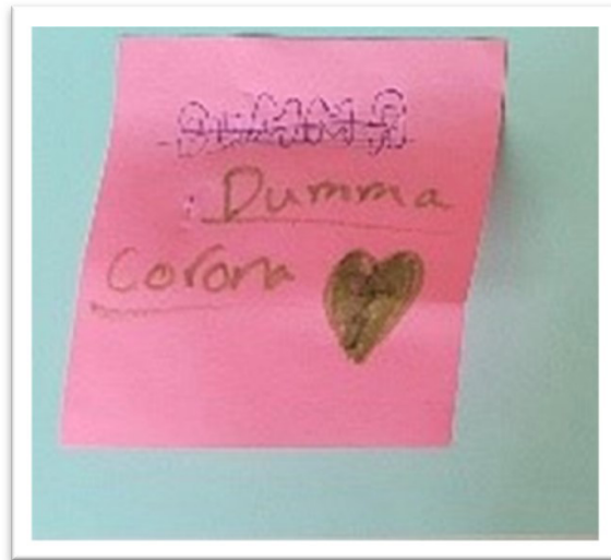
Figur 1: Dumma Corona (Barnanteckning), FGD 4

“Och sen var det såhär, jag kollade bara en dag och efter 10 minuter den gick upp [statistik på antal döda människor på grund av Covid-19] flera miljoner så jag bara tänkte “jag dör, asså jag dör”. Sen när jag fick det och det gick över ... jag tyckte det var mer skönt än jobbigt att ha corona.” (Barn 1: FGD 5)