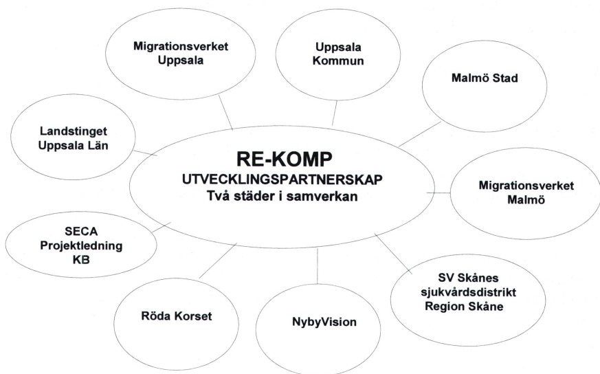
Figur 1: I partnerskapet ingår sex partners med säte i Uppsala - Uppsala kommun, Migrationsverket i Uppsala, Uppsala läns landsting, Röda Korset, NybyVision och SECA Projektledning KB - och tre i Malmö - Malmö Stad, Migrationsverket i Malmö och Sydvästra Skånes sjukvårdsdistrikt Region Skåne

i hemlandet eller annat land. De utvecklade metoderna ska leda till att gemenskapsinitiativets krav på empowerment och jämställdhet tillgodoses.