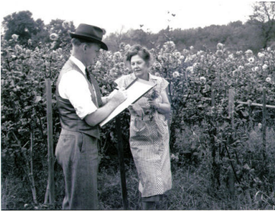
Bland bomullsfälten. Insamling av data till en amerikansk undersökning under 1940-talet.