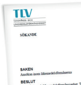
Figur 2. Del av sida där myndighetsdokument rekontextualiseras (s. 19).

Diagrammet (i fyra färger) i figur 1 är försett med flera vetenskapliga källor, och även formen diagram kan sägas höra till en vetenskaplig diskurs, där färgerna gör att det överlappar med en kommersiell diskurs. Genom spårning av de vetenskapliga källorna kunde jag nämligen se att endast gråskala användes i diagram där.