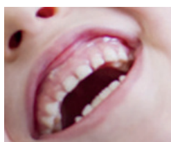
Figur 4. Del av avslutade reklambild (s. 23).

I de två avslutande sidorna byts det vetenskapliga och sakliga ut mot en ren reklamdiskurs. På två stora färgfotografier ser vi människor som ser glada ut och ger intryck av stark gemenskap. Figur 3–4 visar detaljer ur dessa bilder som även i sin bildkvalitet (högupplösta färgfoton, delvis med starkt motljus) ger intryck av reklam, tillsammans med företagslogga och slogan för produkten.