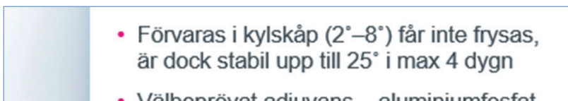
Figur 5. Detalj ur PowerPoint (praktisk information om produkten, s. 21).

På en sida i PP:n finns följande skrift: