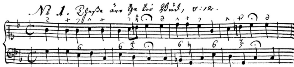
Notex. 7. Början av koralen 1 hos Zellbell d.ä. 1749.

I Zellbell d.ä.:s koralhandskrift 1749 finns på många ställen en rad små tecken över noterna, som indikerar utsmyckningar, här i koralen nr 1: