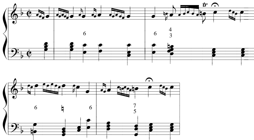
Notex. 8. Början av koralen 1 enligt Zellbells utsirningstecken 1749.

Enligt de förklaringar, som tydligen härstammar från Zellbell själv i Brita Strobills klaver- och orgelbok, 41 bör dessa tecken, som också återfinns i flera av hans intonationer i samma bok, ge koralen följande märkliga utförande: 42