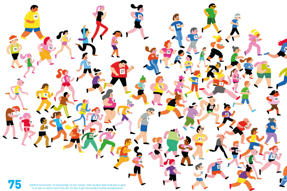
Bild 2. På uppslaget med ett maratonlopp kan flera feta personer uppfattas som barn. Ur Alle sammen teller © Magikon forlag/Kristin Roskifte, 2018.

I ett par fall är denna visuella representation förrädisk då den kan ge sken av att en skymd barnkropp är fet som på ett annat uppslag framträder i helfigur där det framgår att så inte är fallet. 29 Det finns emellertid andra uppslag där feta personer i helfigur kan tolkas som barn. Framför allt gäller det de uppslag där det förekommer ett myller av 200, 400 respektive 1 000 personer som befinner sig på en strand, i ett demonstrationståg eller blickandes upp mot en komet. Det viktigaste uppslaget för vår analys vad gäller grumlandet av ålder är