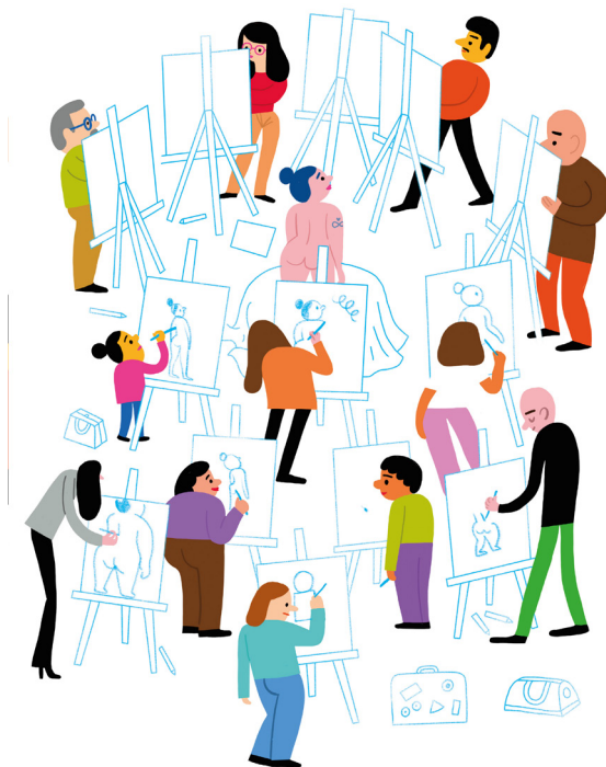
Tretten personer på tegnekurs. Tolv av dem glemmer allt annet mens de tegner. En sikal snart bli pappa for første gang.

modell (bild 3). Att var och en tecknar hennes kropp i olika storlek anspelar på hur varje individ har sitt sätt att uppfatta kroppsstorlek. Krokiklassen inkluderar en deltagare som är kortare än de andra, vilket gör att personen kan tolkas som ett barn, men eftersom krokiklassen i övrigt verkar vara en vuxenkontext kan personen också lika gärna tolkas som en kortväxt person. Detta uppslag, och Roskiftes myller av kroppar i boken som helhet, illustrerar att tolkningar av kroppsstorlek är individuella och att det ofta är svårt att avläsa sådant som ålder och funktionsvariation. Mångfaldstematiken bidrar i det här fallet till att problematisera vår uppfattning av kroppar: hur kroppar växer och åldras varierar stort, och manifesteras i olika kroppsformer. 30 Överlag framträder en förhandlingsmarginal i relation till normativa idéer om storlek och ålder i den visuella gestaltningen av kroppar.