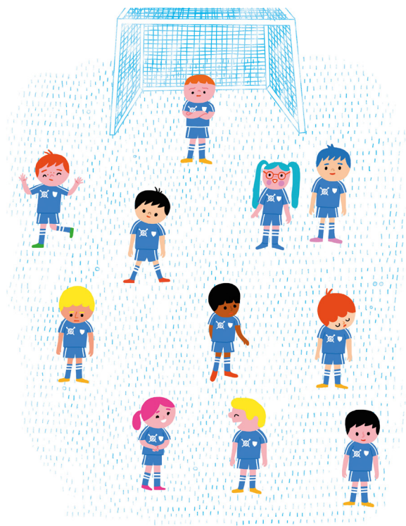
Eleve personer på et fotballag. Ti av dem liker å spille fotball. En gruer seg til å gå på skolen.

Det finns emellertid ett mer traditionellt än kroppspositivistiskt förhållningssätt i boken om kategorin ålder beaktas. Det förekommer många barn i boken, men mycket få av dem kan tolkas som feta. Barnkropparna ter sig i stället som stöpta i samma form. Redan titelbladets barngrupp som står i ring har alla en traditionellt normenlig storlek med mångfalden uttryckt endast genom barnens olika hudfärg. 27 Särskilt påtaglig är bristen på feta barnkroppar på uppslag där barn som grupp utövar fysisk aktivitet. Barnen som har gymnastik (uppslaget numrerat 8), spelar fotboll (11) och leker på skolgården (100) har alla normenlig storlek (bild 1). På uppslag som