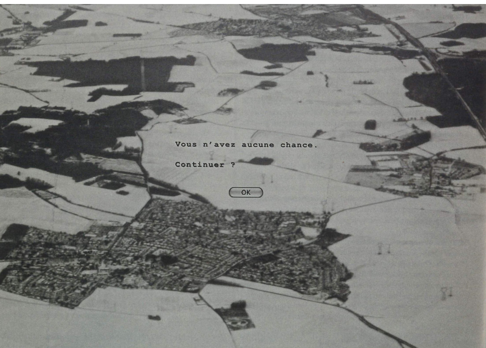
Michel Houellebecq, "Mission #001". Ingick i utställningen Rester vivant på Palais de Tokyo, Paris 2016.

Detta märkliga perspektiv – vi kan kalla det "Houellebecqperspektivet" – återkommer i romaner, fotografier och dikter. I dikten "Variation 49: le dernier voyage" ("Variation 49: den sista resan") betraktar ett osäkert "vi" ett bergslandskap i Anderna från ett flygplan som befinner sig på 8 000 meters höjd: