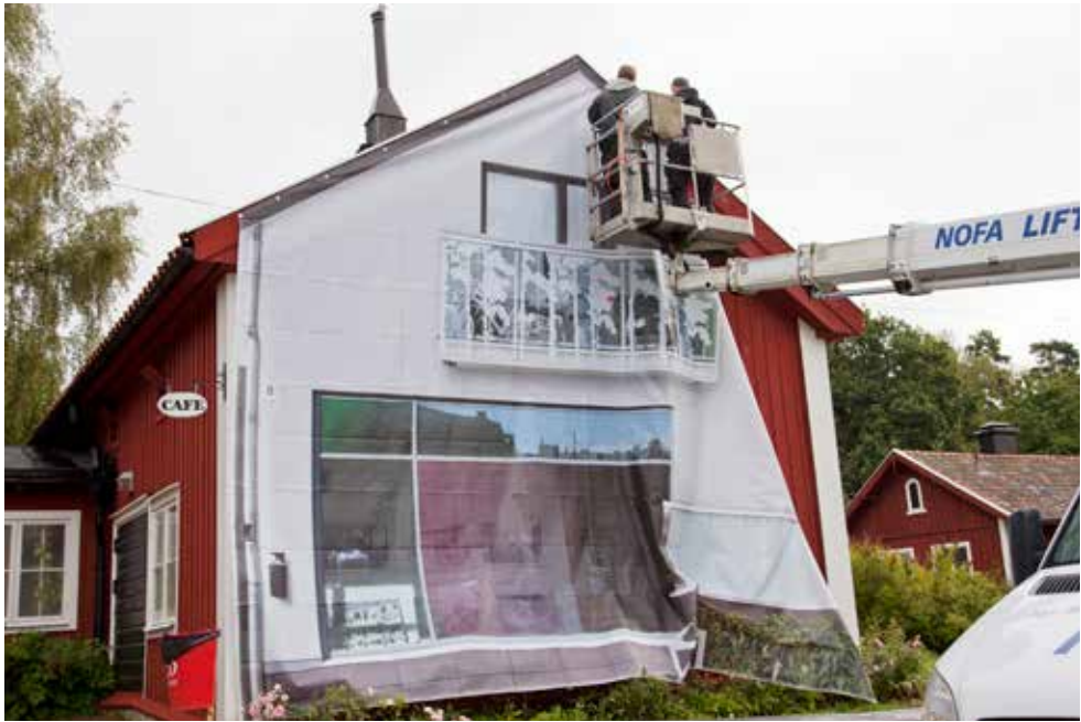
Bild 3: Potemkins kulisser av Åsa Andersson Broms 2012.

utgångspunkten för undersökningen utgår från en särskild persons särskilda känsla och frågeställning. En lust eller oro som inte riktigt är klarlagd och därför behöver formuleras.