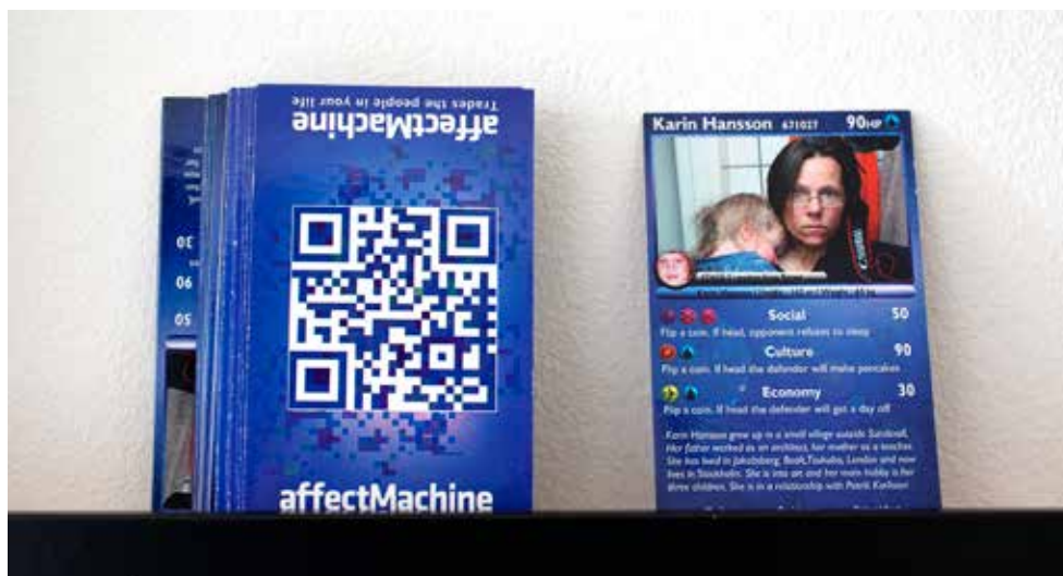
The Affect Machine av Karin Hansson 2012.

skruva till detta sammanhang, luckrar jag upp grunden för min egen förståelse och kan se andra möjliga läsningar.