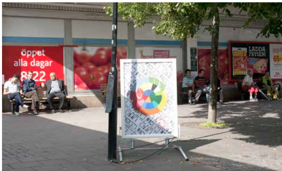
Bild 4: Husby 2012 av Johanna Gustafsson Fürst 2012.

husfasad med mönsterblästrade glasbal-konger, i samma stil som en del av Husbys 70-tals arkitektur har gjorts om i, för att täcka över en av de pittoreska kulturbyggnader som har bevarats i Husby. Genom denna enkla förflyttning från ett sorts hus (miljonprogram) till ett annat (röd stuga med vita knutar) går hon över gränsen för vad som anses vara i behov av ett ”Järvalyft”, och hjälper oss att sätta dagens arkitektvisioner i ett historiskt sammanhang: Det är kanske inte 70-tals designen som är problemet i Husby, utan de sociala problemen och det faktum att man inte renoverat området ordentligt sedan det byggdes. De nymålade sjöstadsvita fasaderna är bokstavligen kulisser för att skymma sikten för de allvarigare bakomliggande problemen. Verket ställer också frågor om