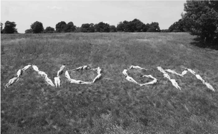
No GMO.

en nakendemonstration i Hong Kong: "Vi är helnöjda med att blotta vår hud för att rädda skinnet på djuren som utnyttjas i modets namn. Denna form av transkorporalitet, i vilken den mänskliga huden vidgas till att omfatta också djurens skinn, skakar grunden för individualistiska uppfattningar om jaget, såväl som den transcendenta människouppfattningen. Transkorporalitet som etiskt tilltal härstammar dessutom från en känsla av köttlig sårbarhet.