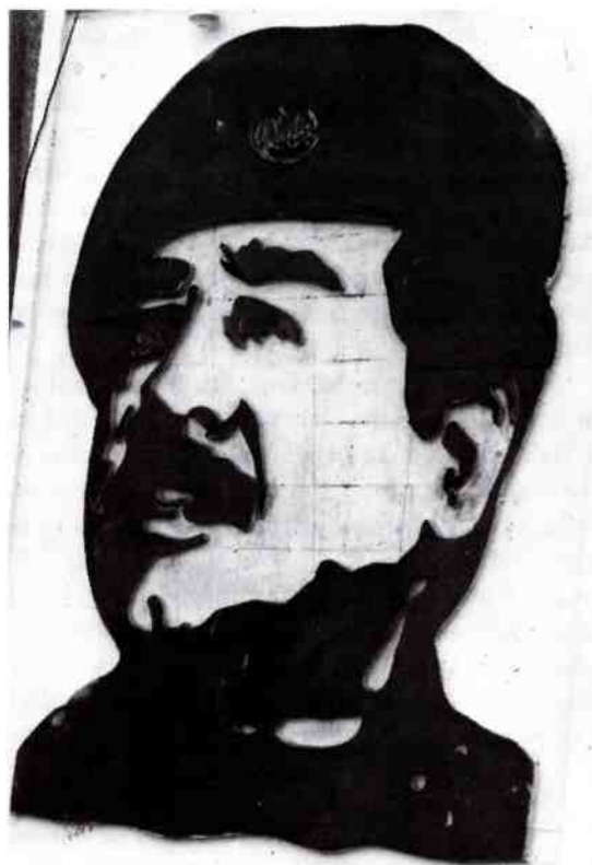
Saddam – soldaten.

80-talet). Jämlikhet mellan könen fanns inte då med på PLOs officiella dagordning. Däremot ansågs det viktigt att höja kvinnors politiska medvetenhet och aktivitetsgrad. Syftet var inte att förändra könsrelationer, utan att få kvinnor att delta i den sociala utvecklingen. 21 Även om Saddam Hussein mycket explicit talar om kvinnors frigörelse, påminner hans beskrivning tydligt om denna hållning till kvinnor. Det primära och överordnade är hela tiden någonting annat än kvinnor, vars frigörelse ständigt måste anpassas till det omgivande samhället, och genomföras utifrån andra premisser än sina egna.