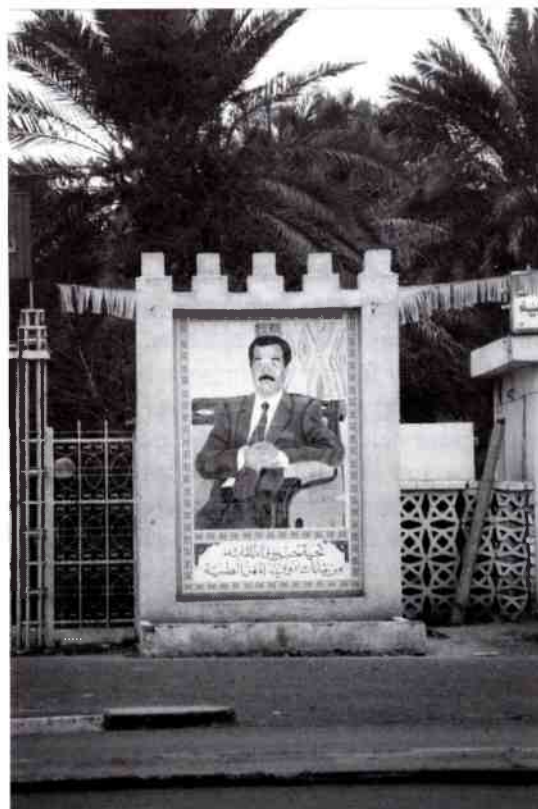
Saddam – den civile.

Även i detta sammanhang är det möjligt att dra paralleller till en palestinsk kontext. Det ska dock poängteras att jämförelser med samma resultat troligen också skulle kunna göras utanför arabvärlden eftersom den skisserade relationen mellan samhällets och kvinnors frigörelse knappast är unik. Inom den palestinska kvinnorörelsen är spänningar mellan nationalistiska och feministiska/kvinnopolitiska krav centrala. Först på senare år har den feministiska medvetenheten ökat, och kvinnopolitiska krav, inom vissa grupper, haft högsta prioritet. 22 Tidigare har den nationella kampen och enheten haft företräde framför krav