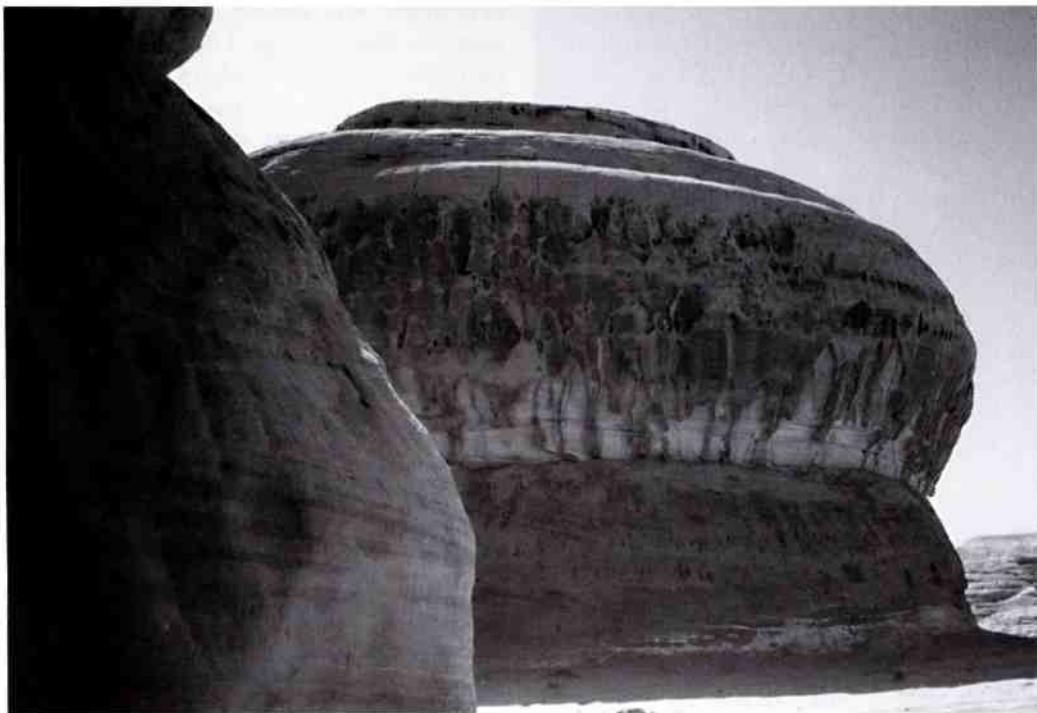
Madain-Saleh, Saudiarabien.

Det sägs att hon aldrig sörjde någon lika djupt som sina älskade bröder Šakhr och Mu'āwiya för vilka hon varit både som en mor och syster eftersom deras mor dog när syskonen var i späda ålder. I populära arabiska texter om al-Khansā' framgår det att en viktig anledning till hennes djupa sorg över brödernas bortgång bottnade i att de aldrig hunnit omfatta den islamiska tron. Sönerna däremot