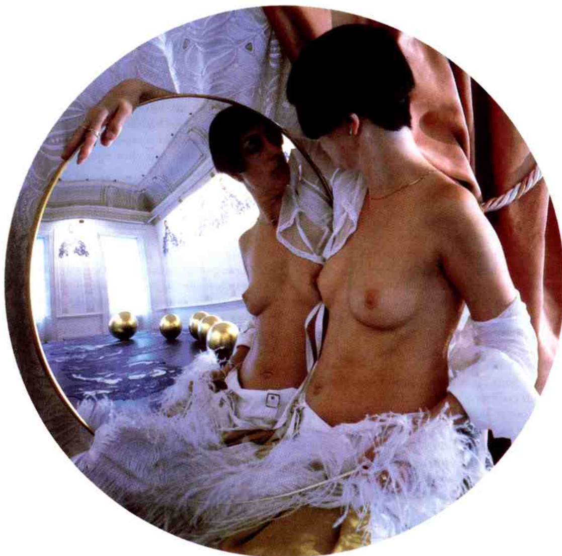
Helen Chadwick, Forføngelighed , 1986. Från utställningen Stilled Lives 1997 vid Kunsthallen Brandts Klædefabrik.

eller otillräcklighet man försöker tillfredsställa genom att överäta. Varför har västerländska kvinnor idag känslan att de är för stora? För stora för vad, för vem, i vilka sammanhang? Enligt vilka måttstockar? För vilka rum är de för stora?