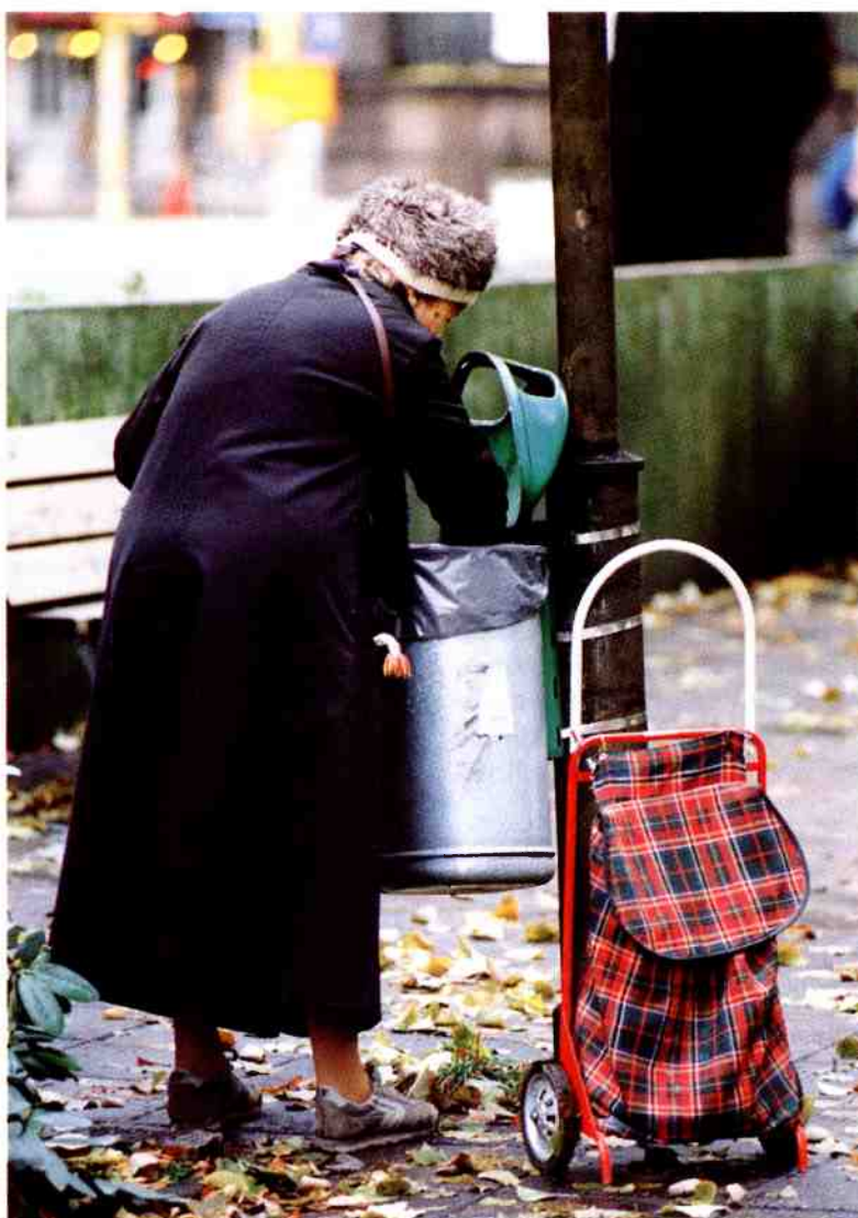
Oktober 1992.

Gunnel Forsberg Kulturgeografiska inst. Uppsala universitet Norbyvägen 18 B S-752 36 Uppsala