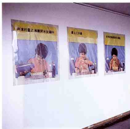
Pernilla Carlsson, Utan titel , 1996.

Jag vill pröva att koppla samman två synsätt. Dels ett könsstrukturellt (och miljömässigt) perspektiv på livsmedelskonsumtionen, dels ett alternativt sätt att se på jordbruket – inte huvudsakligen som ett areellt produktionssystem.