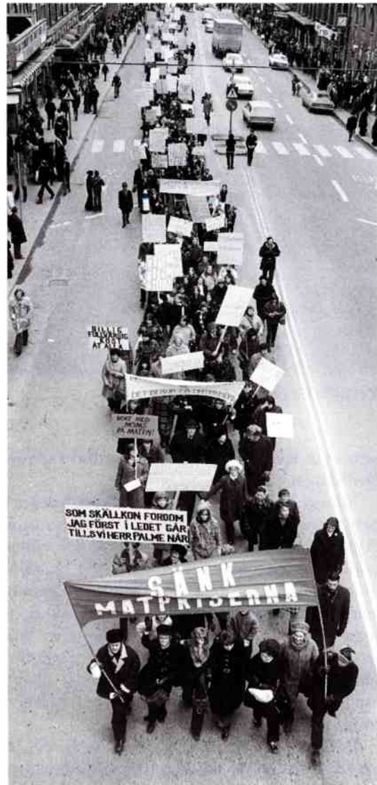
Skärholmensfruarnas matdemonstration i februari/mars 1972.

Stadsplanering har i allmänhet, bortsett från kortare planeringsperioder, utgått från en ideologi om det individuella hushållet med en manlig huvudförsörjare och kvinnlig hushållsansvarig. Här fortlever bilden från en tidig civilisation där mannen = jägaren och kvinnan = samlaren (konsumenten). Även t. ex. de radikala visionerna om "garden cities" hade en romantisk syn på uppdelningen hem/arbete och kvinnans roll i familjen och närmiljön, säger Greed. Feminismen, menar hon vidare, är både ett sätt att se på planeringen och en kraft att förändra den. Men hon är samtidigt pessimistisk och menar att roten till den genderiserade stadsplaneringen