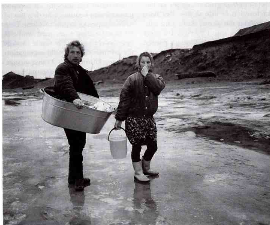
Esko Männikkö/Pekka Turunen, Från serien Pemoht . Bilder från Kolahalvön , 1989-95. Fotografi 70 x 90 cm. Från utställningen "Portrett" på Museet for Samtidskunst i Oslo, hösten/vintern 1996/1997. Se recension på sid 127.

idéer till feministiska grupper om vad man behöver kämpa för och vad man vill värdera hur, och kanske också kring vad som kan tänkas vara möjligt. Typologiskapande, alltså, som brobygge mellan vetenskap och politik.