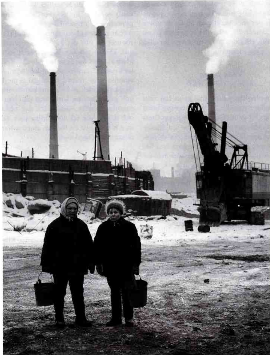
Esko Männikkö/Pekka Turunen, Från serien Pemoht . Bilder från Kolahalvön , 1989-95. Fotografi 100 x 80 cm. Från utställningen "Portrett" på Muscet for Samtidskunst i Oslo, hösten/vintern 1996/1997. Se recension på sid 127.