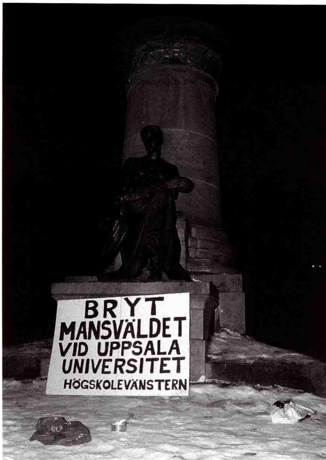
Kampanjbild från kårvalet i Uppsala 1996.