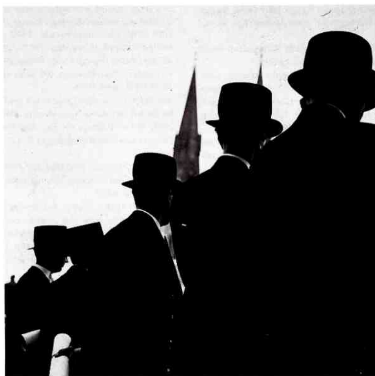
Promotionsbild från Uppsala universitet. Originalen finns på Uppsala universitetsbiblioteks kart- och bildavdelning.

forskningsobjekt etc. Inom kvinnoforskningen allmänt drevs på nationell nivå samtidigt en "gå på två ben-strategi": dels etablera kvinnoforskningsmiljöer, dels stödja kvinnliga forskare ute på institutionerna. Man kan säga att man valde både en särorganisering för utveckling av en bas för framtida successionsstrategier internt inom kvinnoforskningen och en integreringsstrategi som gav ett fundament för subversiva strävanden inom respektive disciplin.