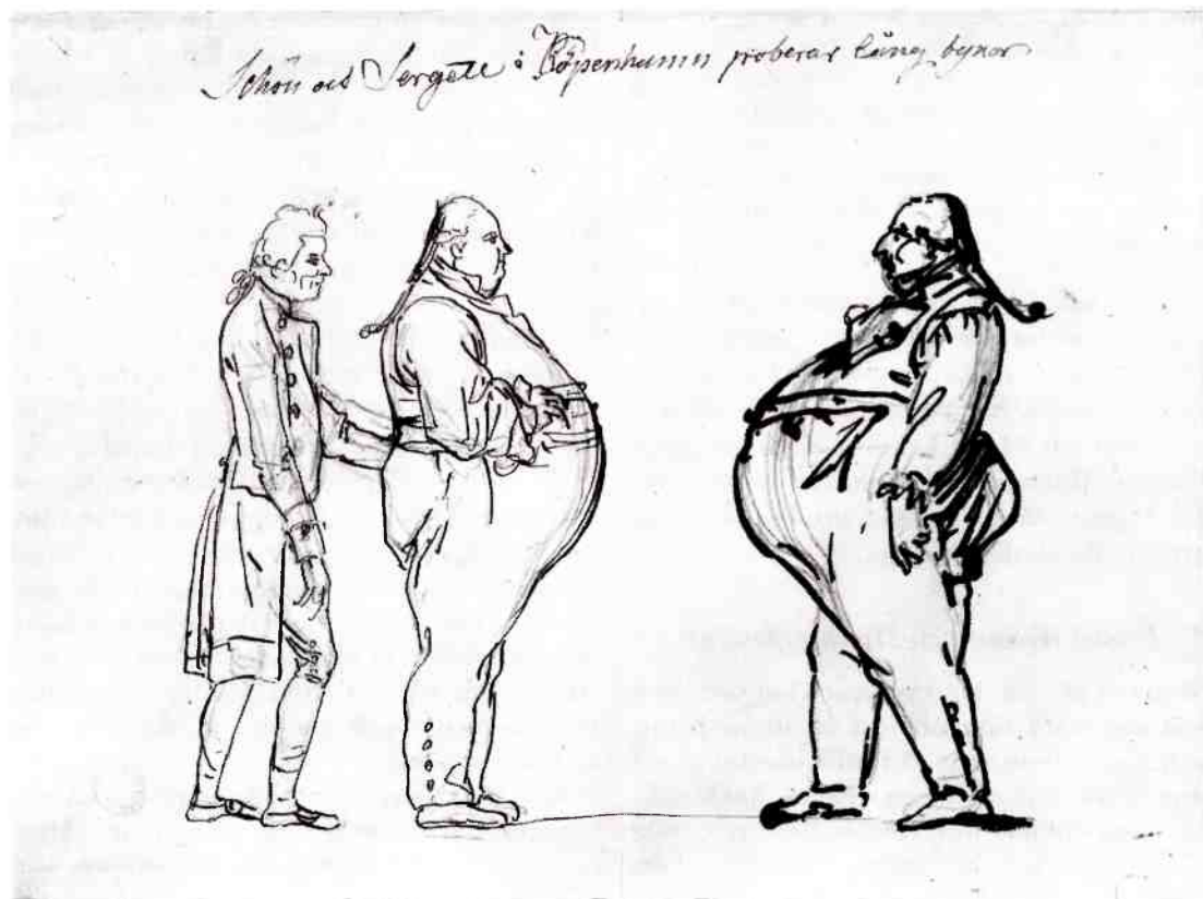
Johan Tobias Sergel, Schön och Sergel i Köpenhamn pröberat långbyxor (från utställningen "Klädd och oklädd", Nationalmuseum, våren 1996).

Baserna är mer i klungan av killar och snackar bland annat om tjejen som finns på monteringsbanan. 6