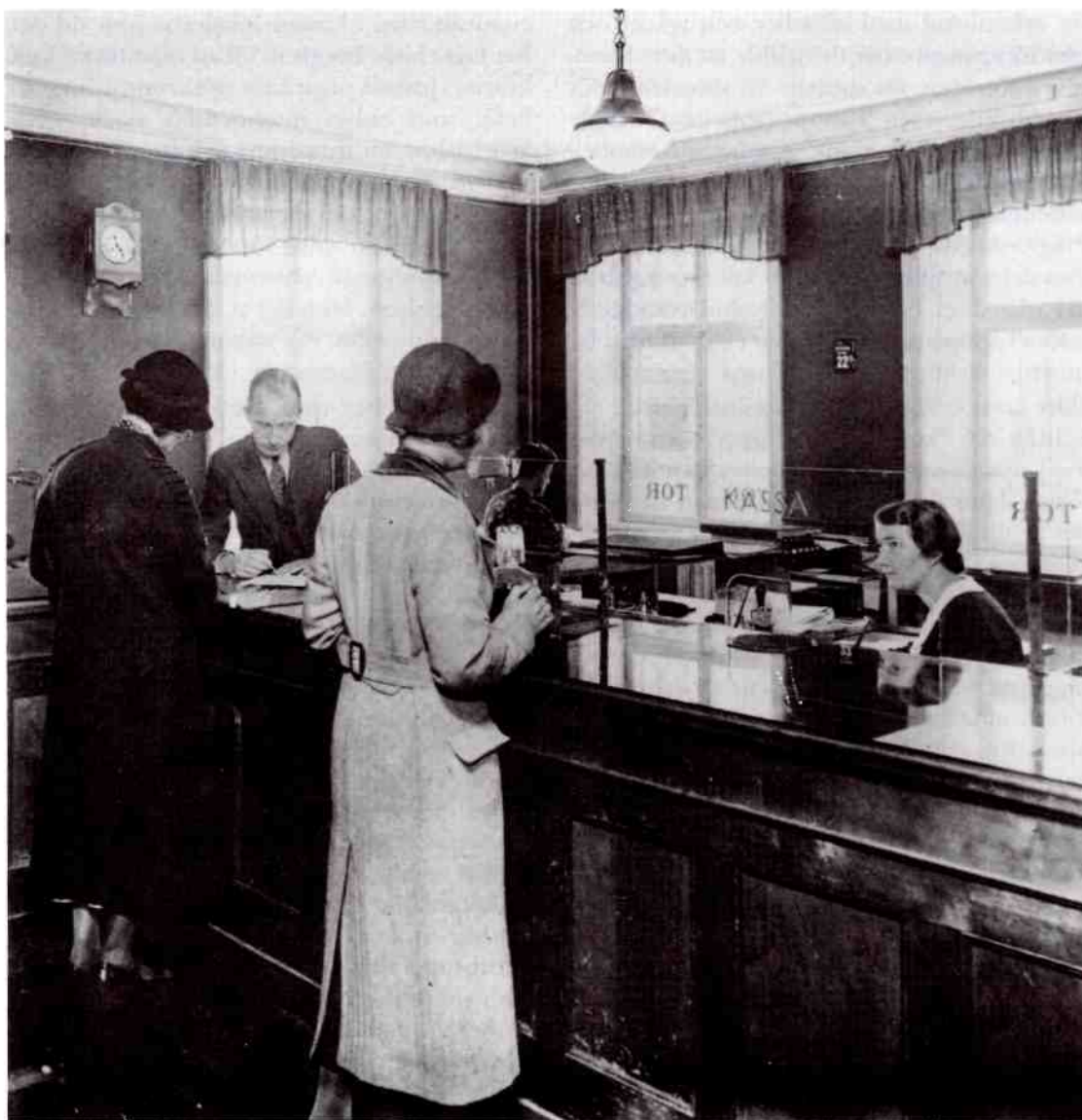
Kontorsvärldens "allmänningar" var öppna för insyn och utestängde alla möjligheter till enskildhet. Det var de utrymmen där den sociala kontrollen var som störst.

Till allmänningarna, som delades av många, kunde man däremot gå utan att knacka. Där saknades möjligheter till personlig integritet. De kvinnliga tjänstemännen hamnade allt oftare i sådana utrymmen, t ex i de separata skrivmaskinsrummen som hade inrättats för att de manuella skrivmaskinerna ansågs störande med sitt knattrande ljud. På 1970-talet, under den tayloristiska arbetsspecialiseringens sista högkonjunktur, skulle dessa omformuleras till skrivcentraler.