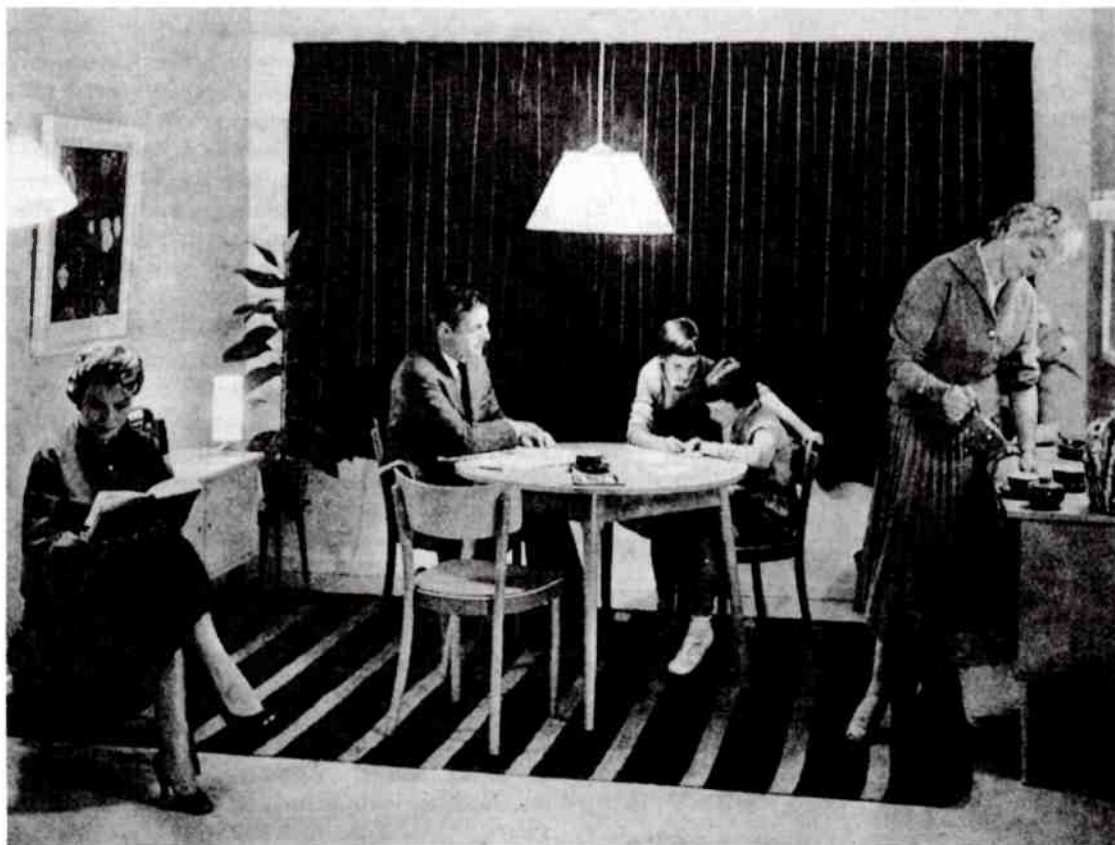
Bilderna av far som läser medan mor serverar te visar vilka aktiviteter som formar hemmets idé. Även om hushållsarbetet skulle kunna utföras av alla förblev det kvinnans uppgift!

strikt separerat från vardagsrummet. Vardagslivet skulle dock inte begränsas till köket, ty hemmet var "en plats där barnet lär sig förstå sin roll i tillvaron". Kvinnan, som husmor och mor, skulle inte ständigt uppehålla sig i köket utan istället vara tillsammans med de andra familjemedlemmarna, särskilt barnen. 9 Detta gav bl a upphov till experiment med skiljeväggar av glas mellan kök och vardagsrum.