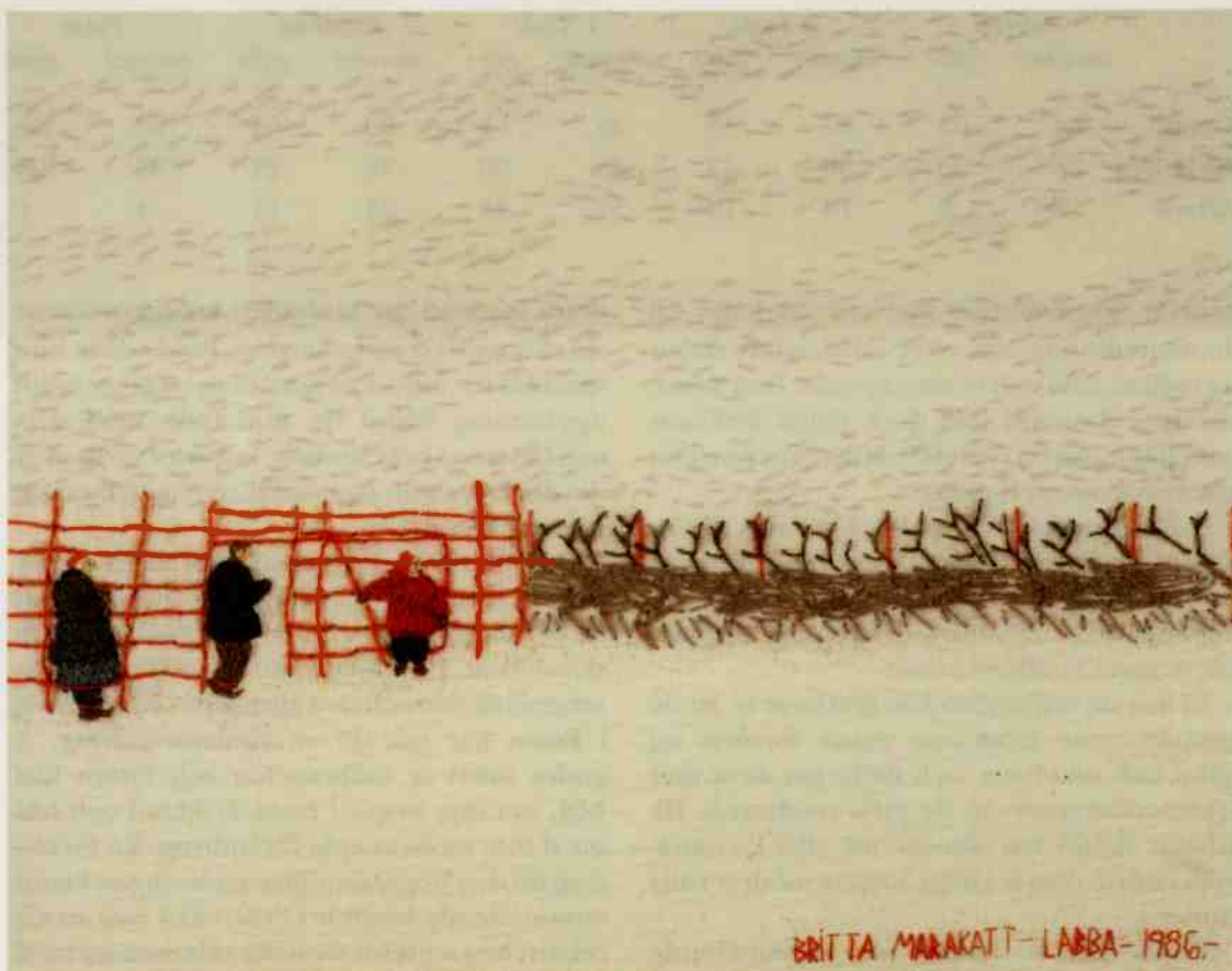
Väntan. Broderi av Britta Marakatt-Labba.

illa. Det gäller dock inte för Sverige, där mellan 80-90 procent av mödrarna är mycket positiva till barnomsorgen.