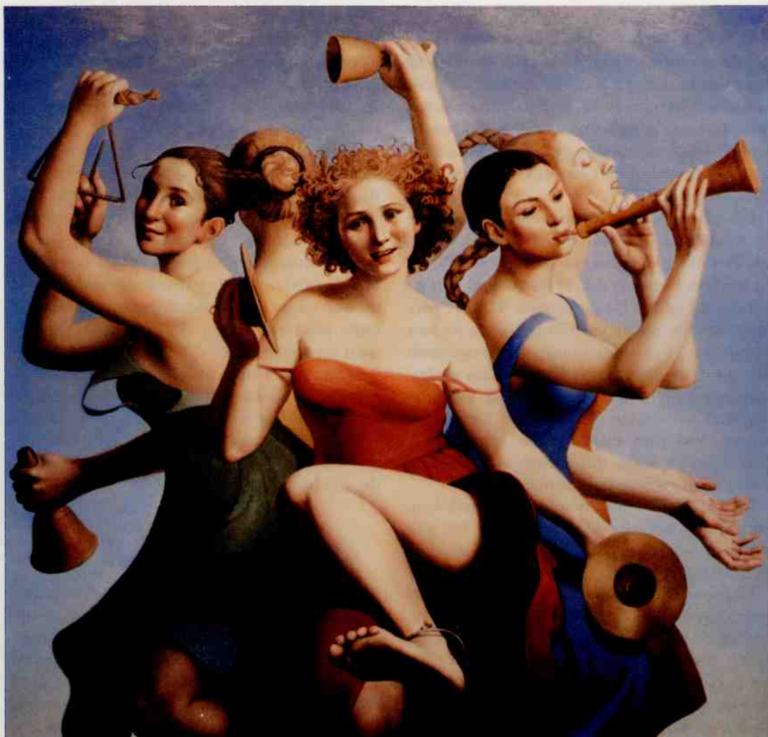
Musikanter. Målning av den norska konstnären Trine Folmoe.

kräver åtminstone college (dvs en nivå mellan universitet och gymnasium) eller universitetsutbildning. Mellan 60 och 80 procent av alla ingenjörer, tekniker, planerare och ekonomer är kvinnor.