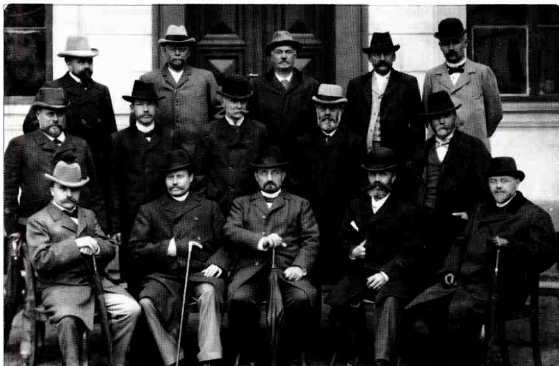
Läroverksläraren var idealtypen av en bildad medelklassman med paraply, käpp, hatt, mörk kostym, kravatt och fadermördare. Förhållandet mellan lärare och elev skulle fungera som ett fader-sonförhållande, men detta ideal ville inte alltid infinna sig. Många elever minns sina lärare med fasa, andra har mycket positiva minnen. Lärarkollegiet i Västerås vid sekelskiftet.

ga elevkulturen var också en arena där norm- och regelsystem prövades och ifrågasattes. För dessa pojkar var det alltså minst av allt självklart att man i alla lägen skulle underkasta sig en given ordning. De erfarenheterna var säkert relevanta för en blivande makthavare, och att denna bråkiga kultur trots allt tolererades inom vissa gränser, är måhända ett uttryck för att det inte var fråga om en renodlad motkultur . Dessutom var den ett led i experimenterandet med och formandet av en egen identitet och ett sätt att prova på den vuxna manskulturens fröjder.