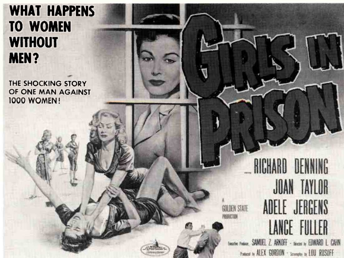
Filmaffisch. "Girls in Prison" (1956).

nen. En illustration av detta är t ex Brun-Gulbrandsens Kjønnsrolle og ungdomskriminalitet (1958). På basis av en undersökning bland norsk ungdom konkluderas att båda könen bedömer flickors avvikande uppträdande strängare än pojkars och att flickors och pojkars olika uppfostran kan förklara den låga kvinnokriminaliteten.