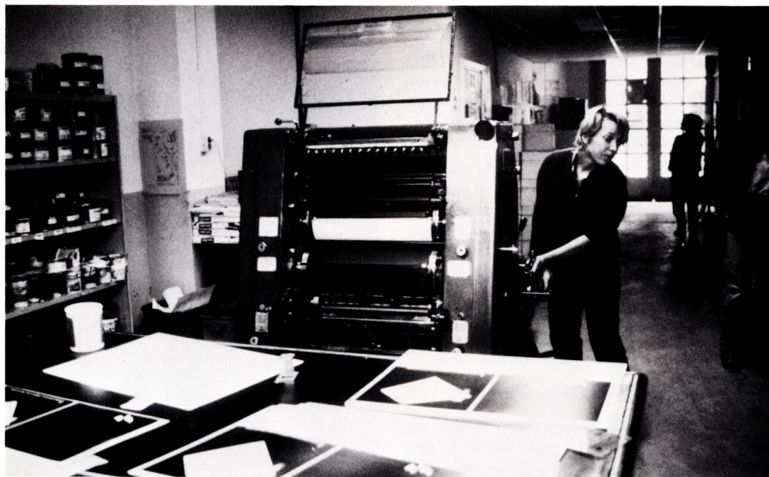
Tryckeri, kollektivt drivet av kvinnor, Holland.

början ideellt arbetande kvinnor företaget. Dess historia är historien om hur kvinnor som har mod och vilja, och som gemensamt har de nödvändiga resurserna, kan göra det ingen trodde var möjligt.