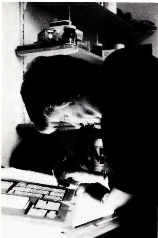
Interiör från kvinno-tryckeri, Holland.

strategi för att bryta arbetsdelningen mellan könen och männens position på arbetsmarknaden, eller om det är en individuell strategi som kvinnor använder sig av för att möta de ofta motstridiga krav som ställs på dem i deras dagliga liv.