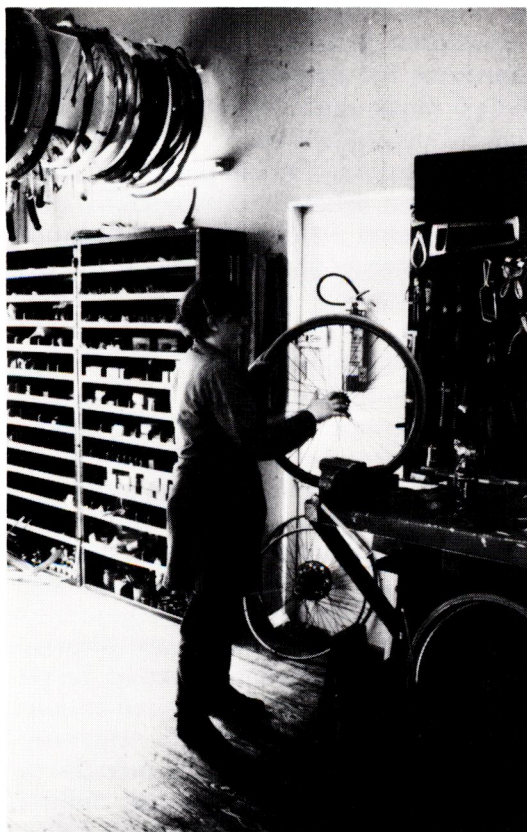
Cykelreparatör, Amsterdam.