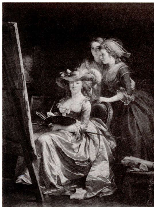
Adélaïde Labille – Guiard, Självporträtt med två elever, 1785, olja på duk, Metropolitan Museum of Art, New York

För detta resonemang använder vi oss av empiristisk kunskapsteori, eftersom dess slutmål är detsamma som vårt: objektiva, värderingsfria forskningsresultat. Denna feministiska empirism hävdar att sexism och manscentrering är sociala fördomar. Alla befrielseörelser i ett samhälle ”gör det möjligt för människor att se tillvaron i ett större perspektiv, eftersom de river bort det täckelse och de skygglappar som fördunklar