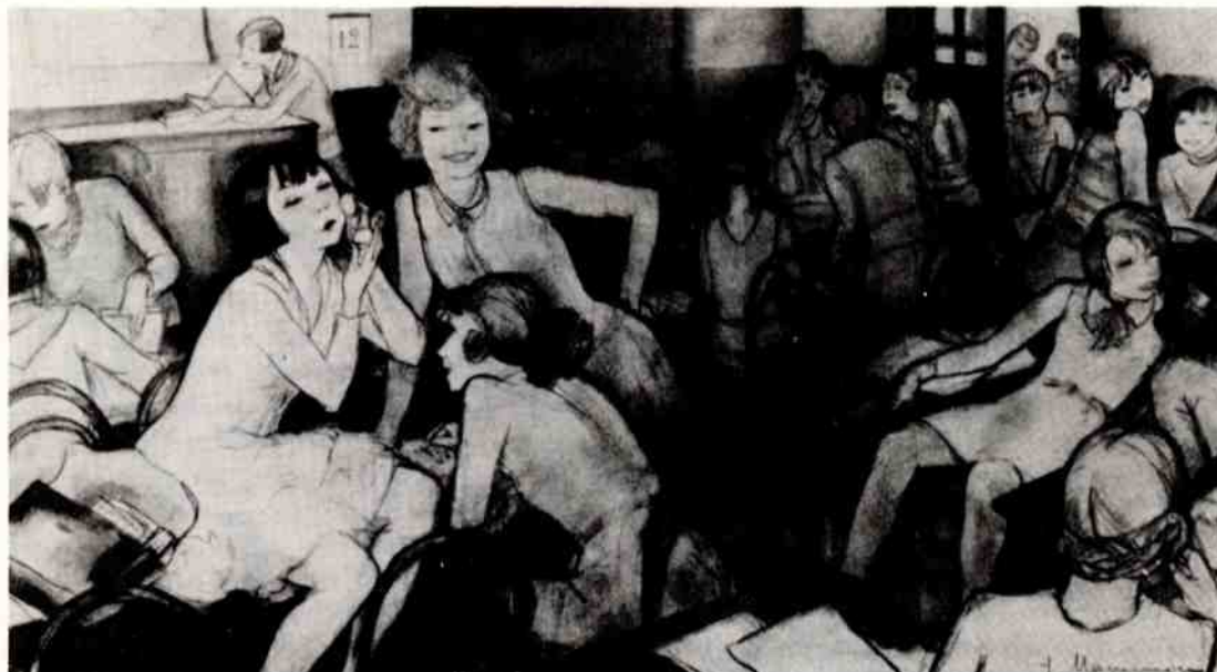
Jeanne Mammen, "Den förtappade", akvarell 1929. Samling Axel Springer, Berlin.

duktion, medan man i Västtyskland undersöker antingen ungdomskulturernas eller de generella samhällsförändringarnas betydelse för ungdomars identitetsbildning. Och där engelsmännen tar avstamp i sociologin, bildar psykoanalytiska och pedagogiska teorier utgångspunkt för den västtyska forskningen.