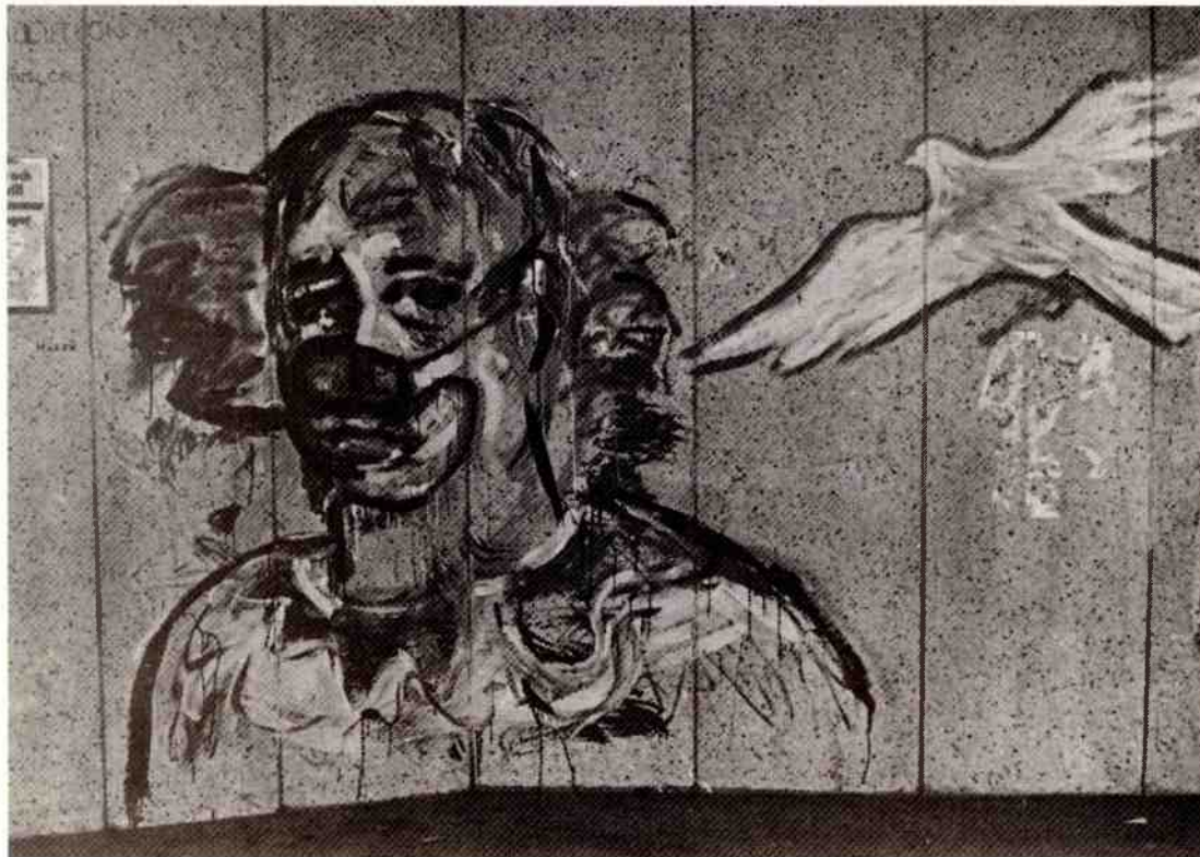
"Höken", Brigadmålning i Mariatorgets tunnelbanestation, Stockholm, 1978.