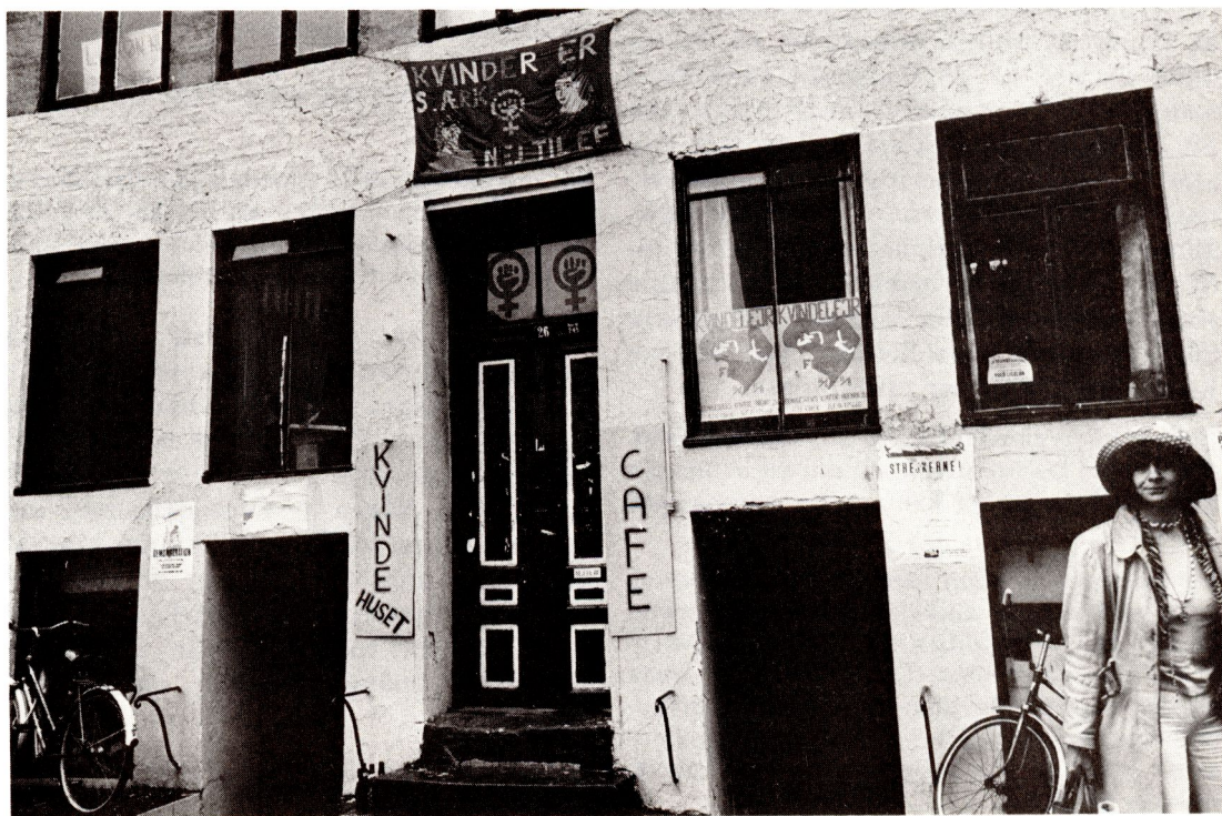
Kvinnohuset i Köpenhamn.

Har du upplevt några speciella problem som kvinna i politiken – har du t ex blivit diskriminerad eller åsidosatt? 17 procent av alla kvinnor i kommunen svarade "ja" på