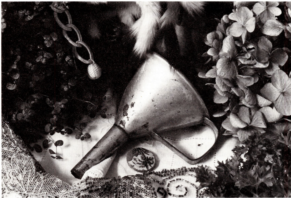
Gunilla Ahlström, 'Kvinnligt stilleben' 1982, foto.

Om vi alltså inser det nödvändiga i att dokumentera vår historia, så återstår ändå frågan hur och när det ska ske. Mestadels går det inte utan en viss arbetsdelning. En dokumentationsgrupp bildas, som följer och nedskriver processen noggrant, nästan som en krönikör. En sådan uppdelning blir sedan nödvändig när alla är så engagerade av projektet, rörelsen eller aktionen att de knappt