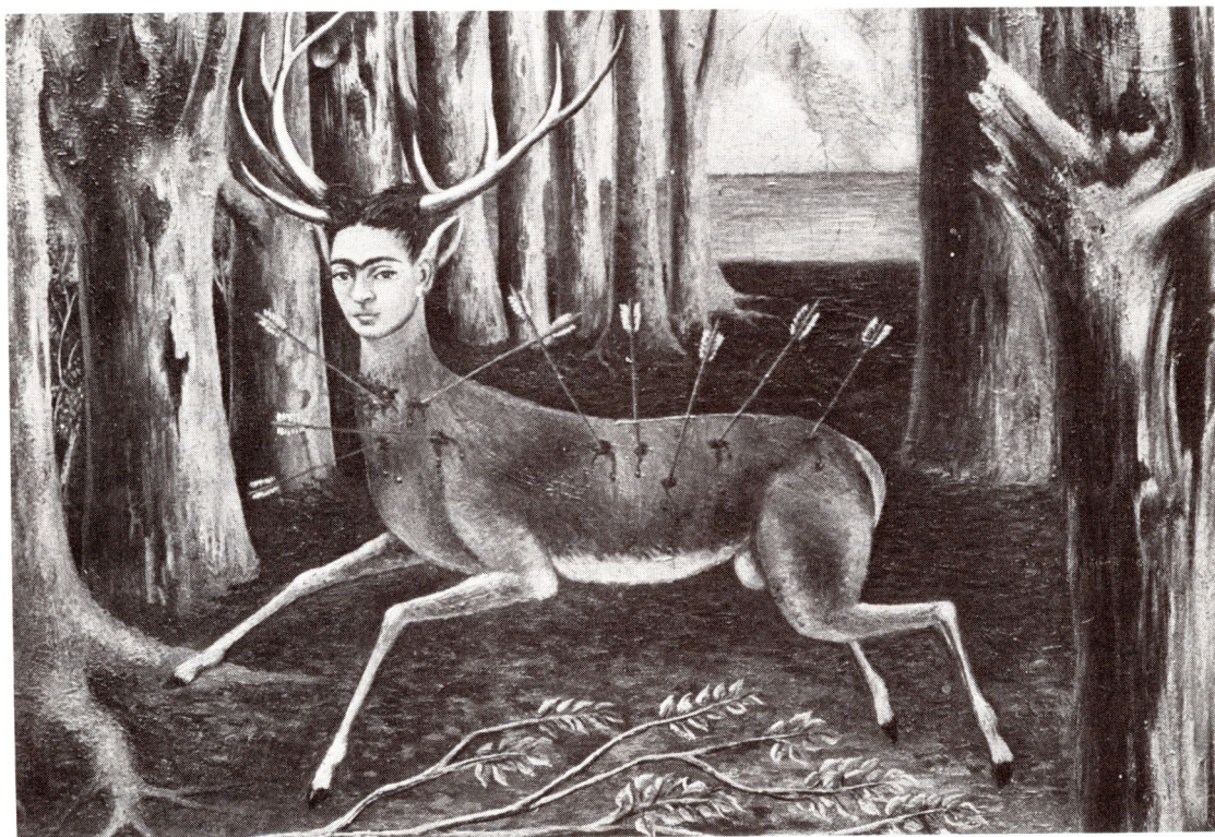
Frida Kahlo: 'Det lilla rådjuret', olja på masonit, 1946.

Marxisterna, i synnerhet de som var knutna till Institutet för social forskning i Frankfurt, 17 har kritiserat denna objektivitetsideologi och ifrågasatt den positivistiska idén att man kan generalisera vetenskapen liksom föreställningen att sanningen kan uttryckas i kausala relationer oberoende av tid och rum. De gjorde gällande att positivistiska metoder bryter sönder