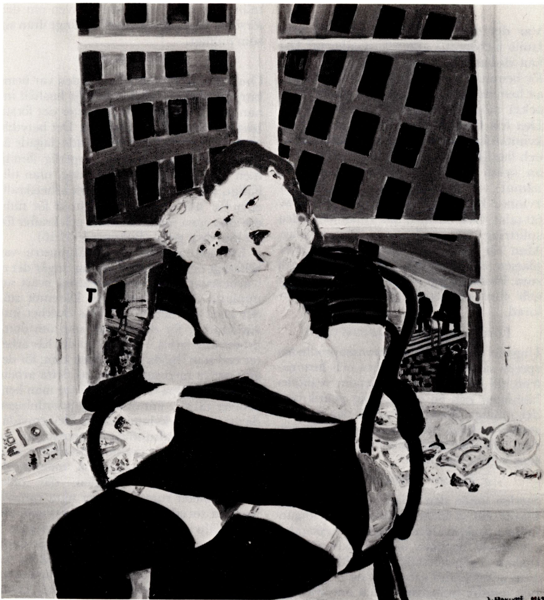
Lena Cronqvist: 'Förortsmadonnan', 1969. Moderna Museet.

jer. En pressande bostadsbrist leder till att flertalet kommer via bostadsförmedlingarna som prioriterar de behövande, dvs familjer som bor trångt och omodernt. Denna form av stadsplanering är ett led i spridningen av intimsfären till också arbetarklassen . På så sätt sprids en familjeorienterad livsstil, familismen, i samhället under efterkrigstiden. Den livsstil som ursprungligen