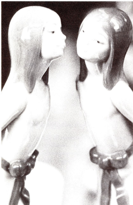
Är våra ovana relationer mellan jämbördiga parter så förlamande att vi alltid...