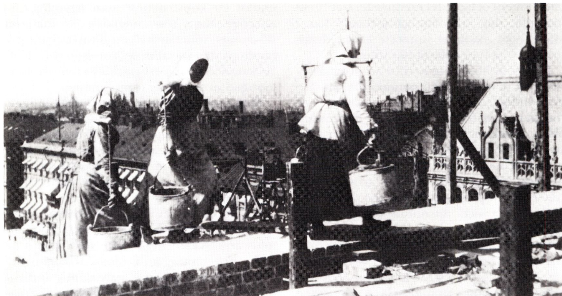
Mursmäckor i arbete på operabygget i Stockholm, 1890-talet.

och han kan endast sälja vad han äger, sin egen personliga arbetskraft. 37